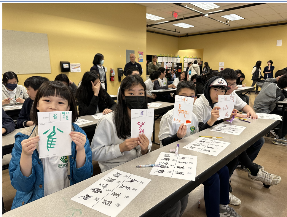
中高年級漢字演變體驗活動書寫