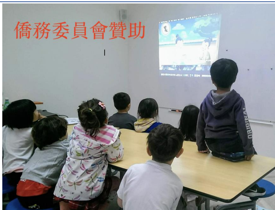
TCC期末學藝競賽-漢字聽說讀寫挑戰賽