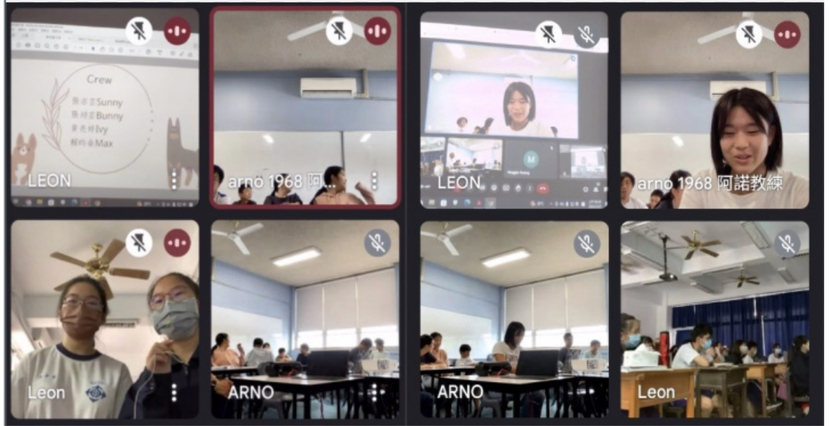
苗栗公館國中與雪梨臺灣學校學生互動