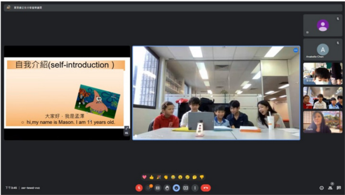
臺灣新竹竹蓮國小學生自我介紹