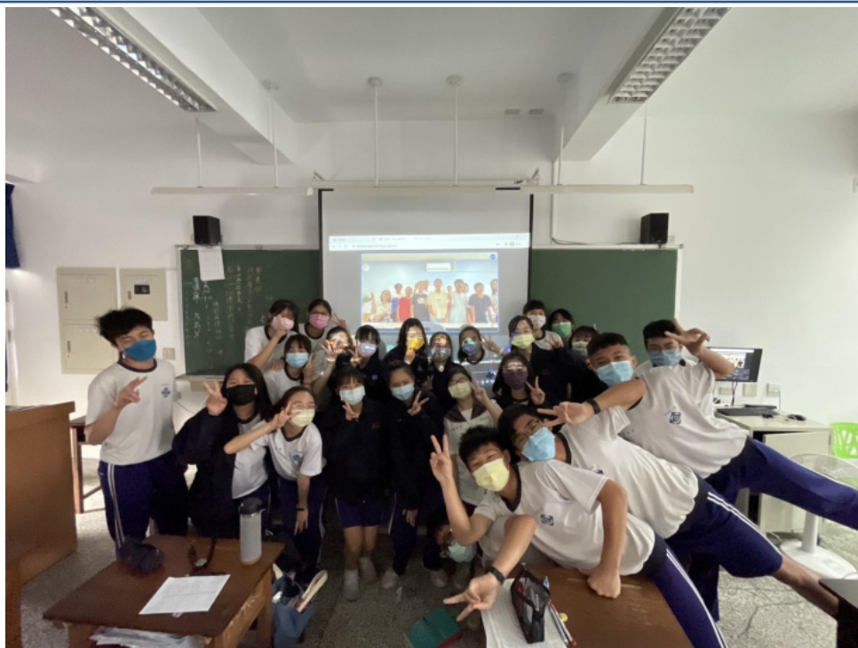
雪梨臺灣學校和苗栗公館國中學生合影