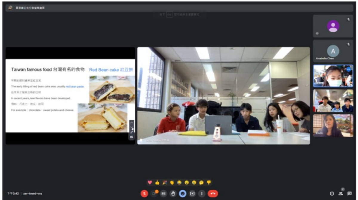
臺灣新竹竹蓮國小學生分享紅豆餅