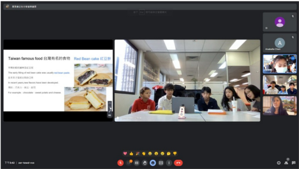
臺灣新竹竹蓮國小學生分享紅豆餅