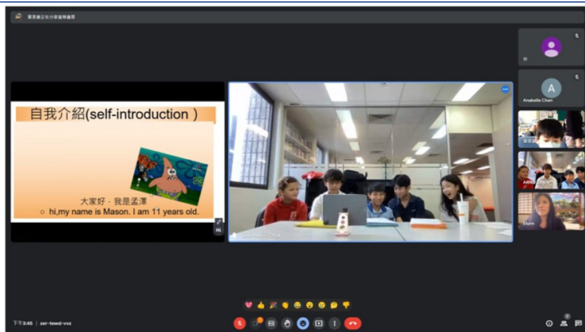
臺灣新竹竹蓮國小學生自我介紹