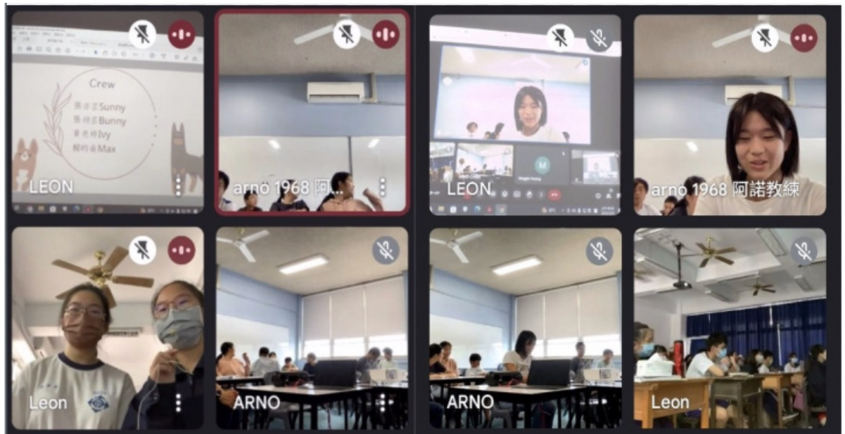
苗栗公館國中與雪梨臺灣學校學生互動