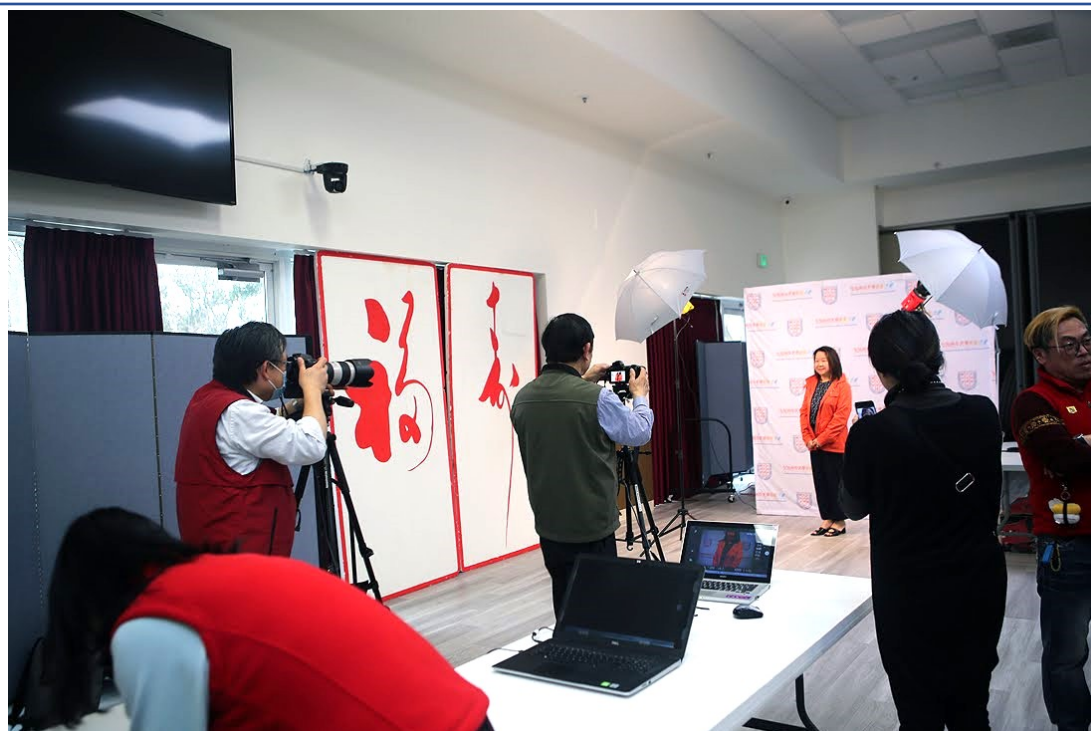
攝影組設置的沙龍拍照工作室