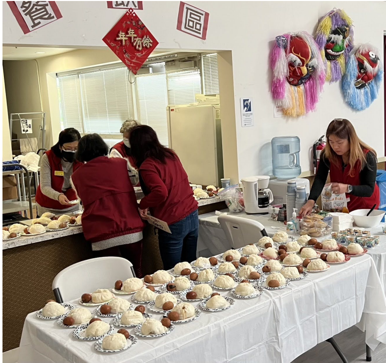
活動組 準備的點心茶飲