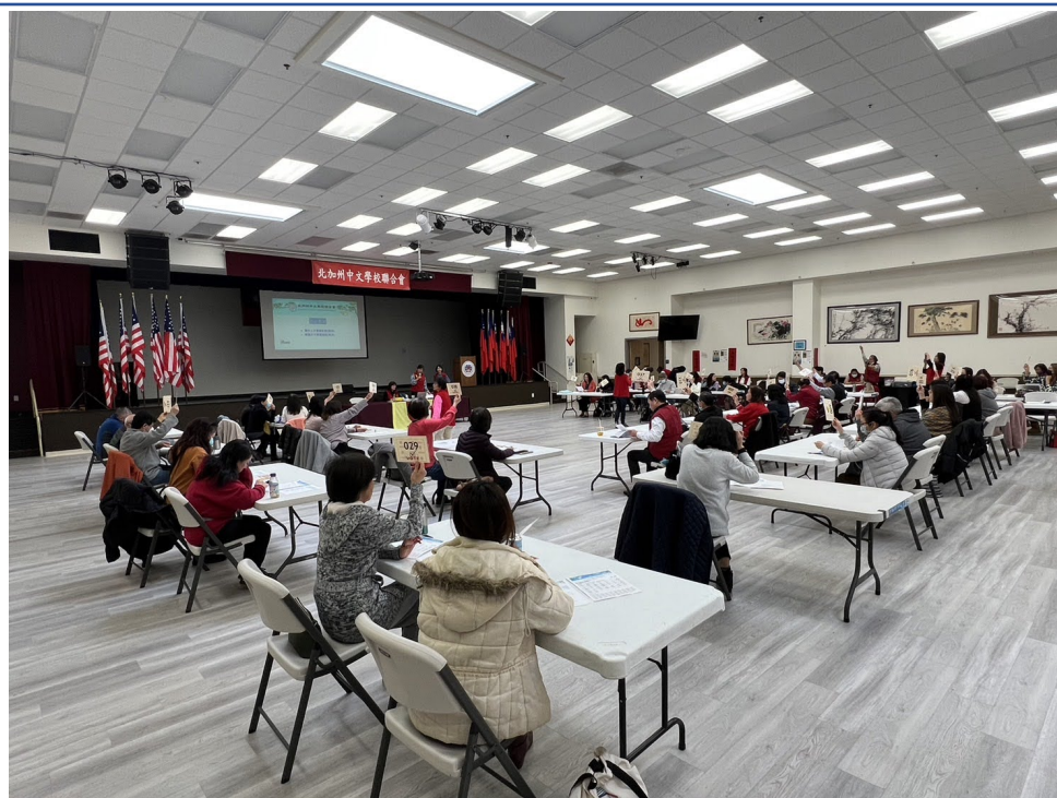
會員學校理事們表決議案（一）