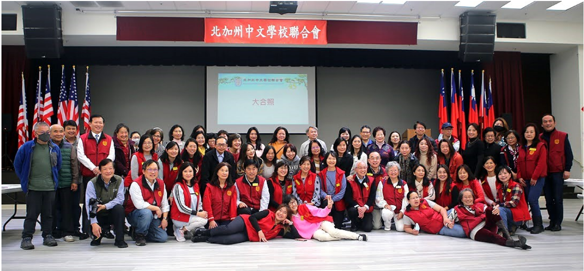
會員學校理事們與本會工作同仁們大合照