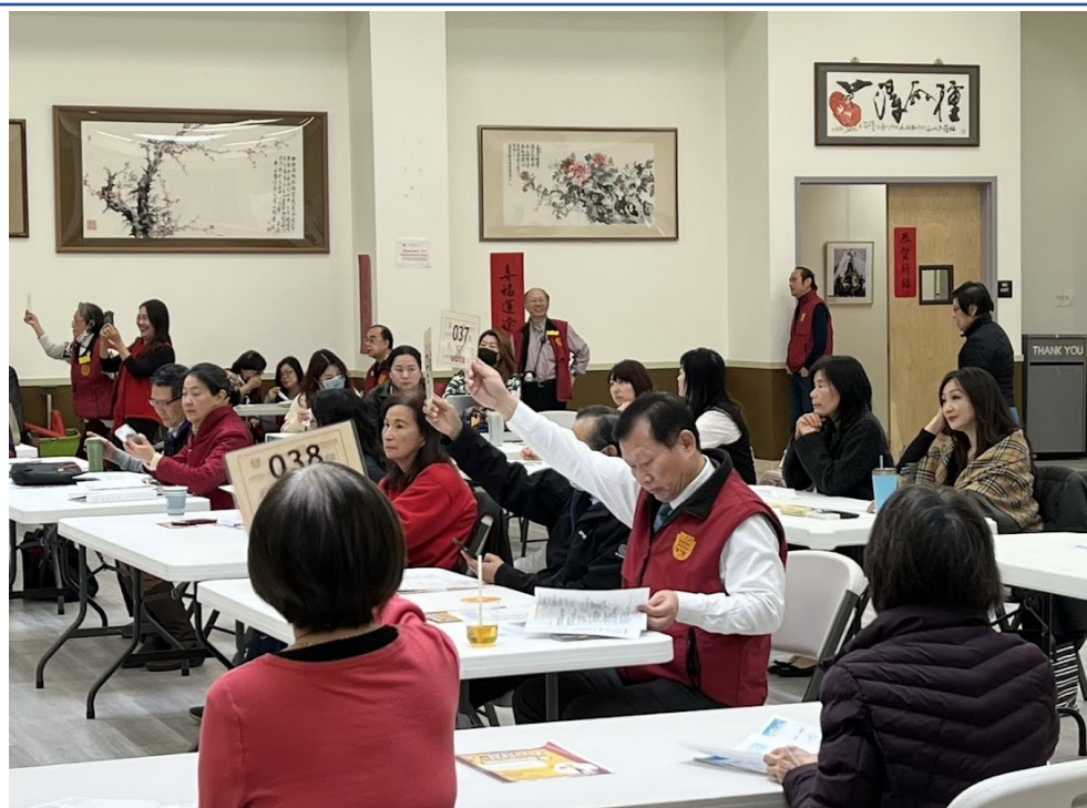
會員學校理事們表決議案（二）