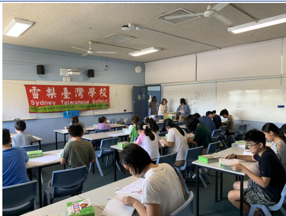
西北校區學生專注查字典