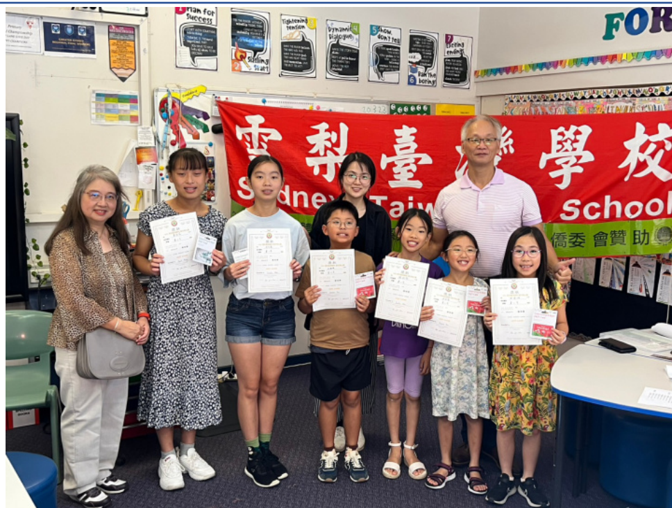
得獎學生與校長老師合影