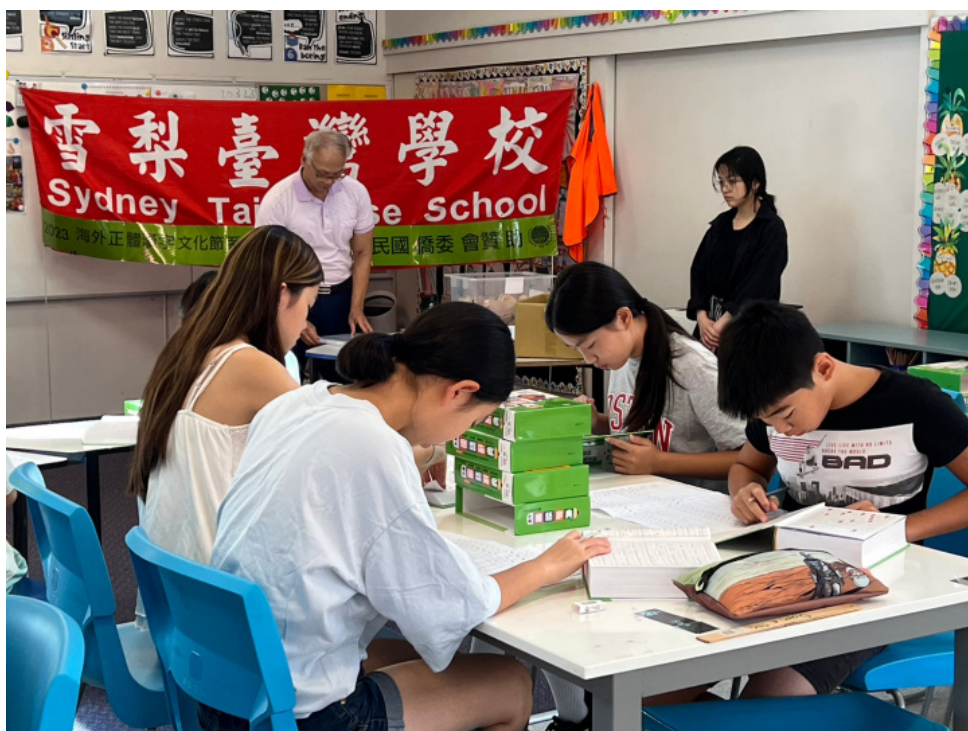
北岸高年級學生聚精會神查字典