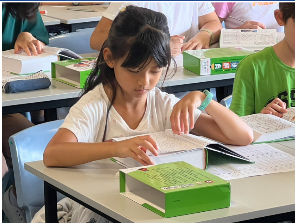
低年級學生認真投入競賽