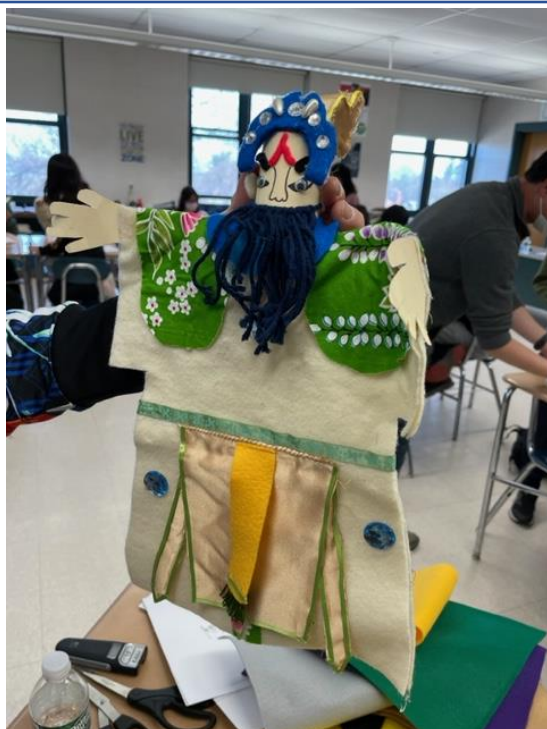
路永宜老師先展示她親手做的布偶成品給七年級學生看