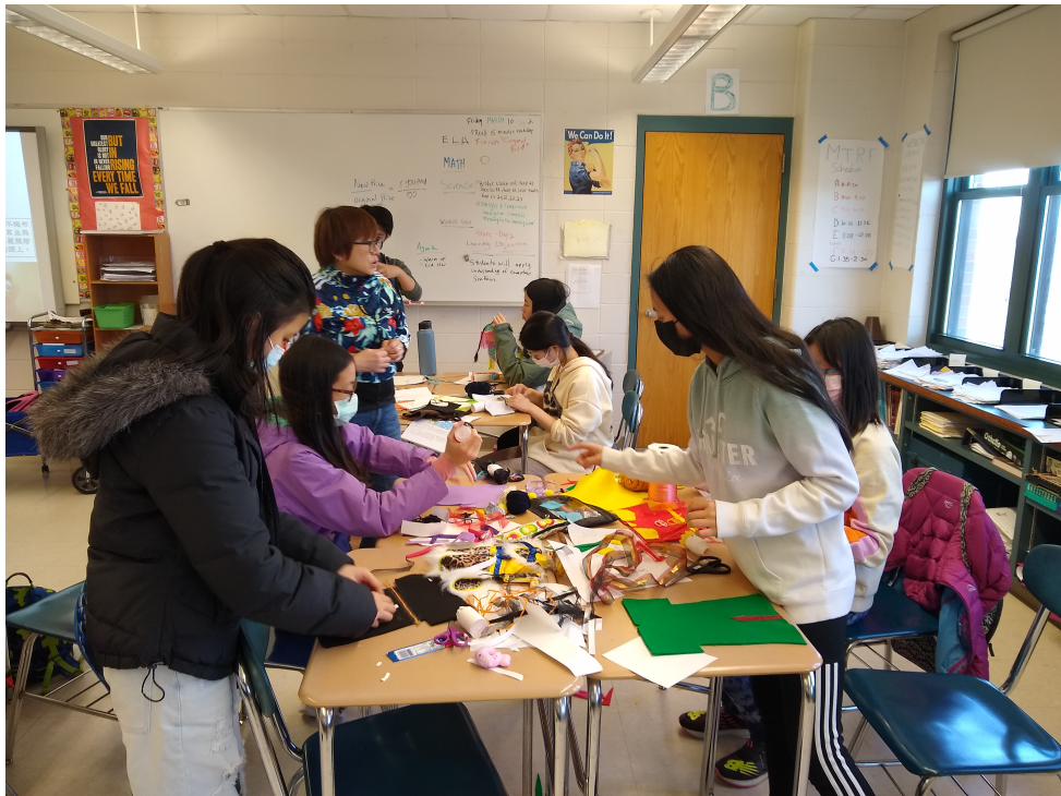
學生開始動手作出心目中的布偶人物