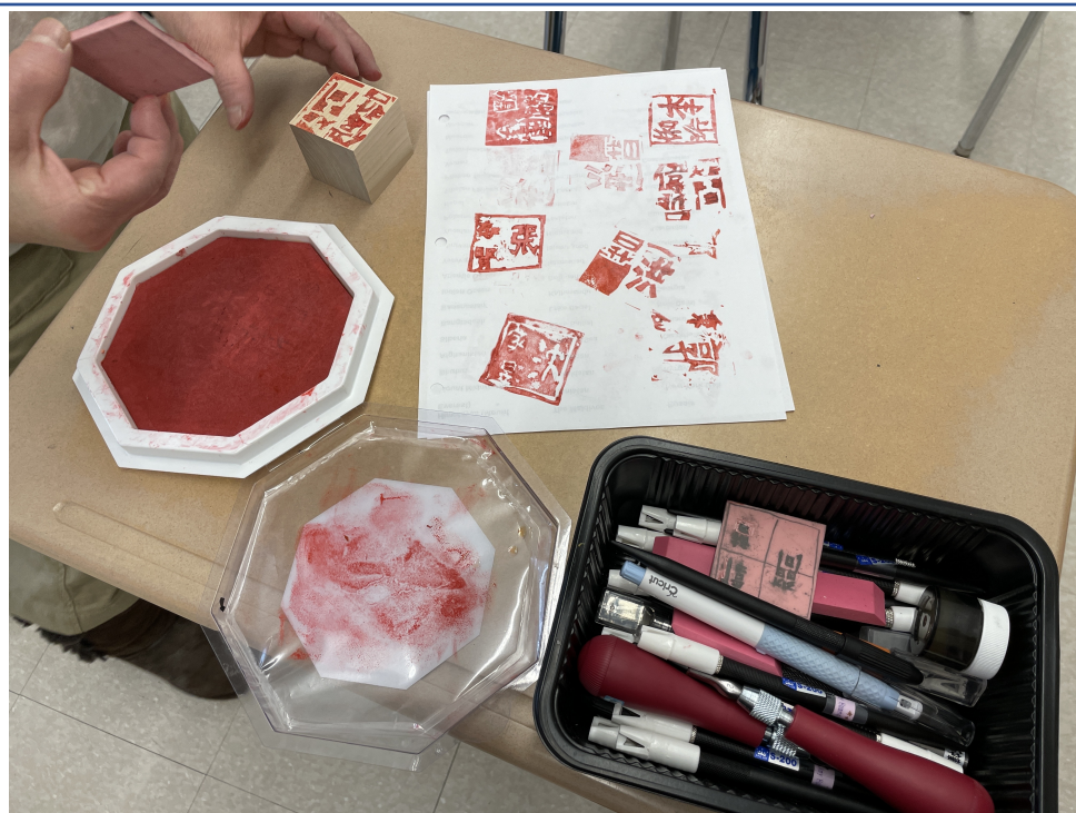
同學們刻印的成果！