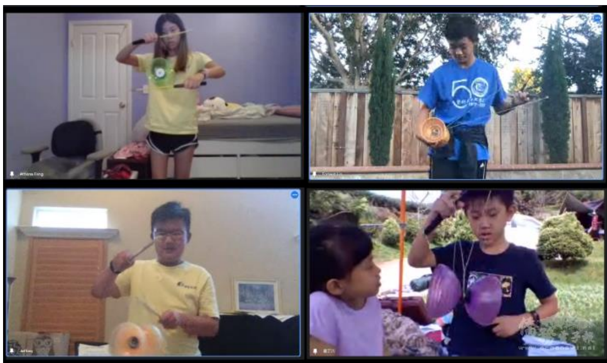
雙方學生展示以單鈴為主的纏繞招式或套路。