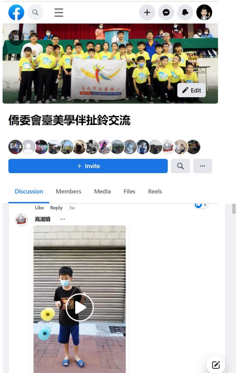
2022年6月創建臉書群組以提供非同步扯鈴技巧交流平台