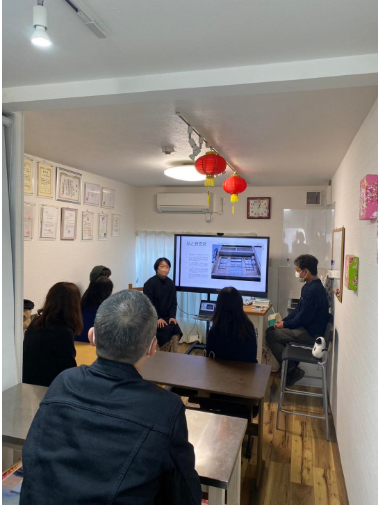
臺日鐵窗花分享講座