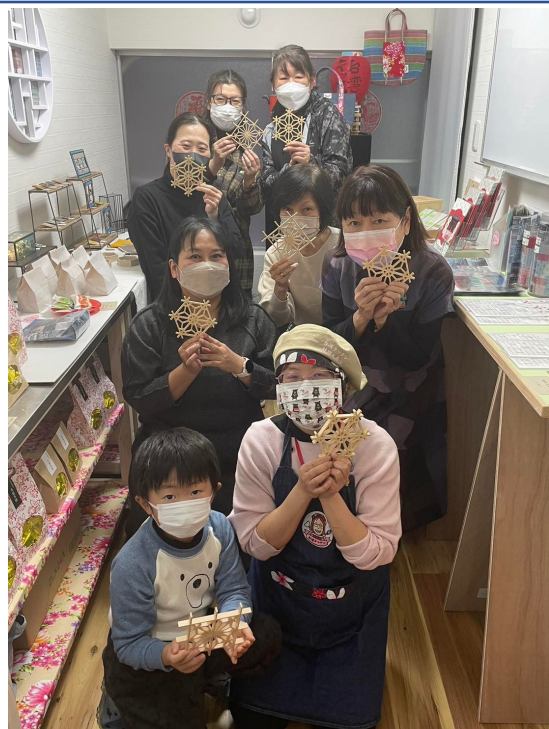
大家完成自己的杯墊作品