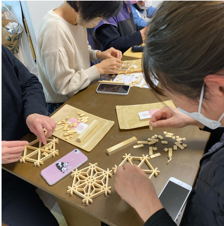
參加者們體驗組合木花窗的杯墊