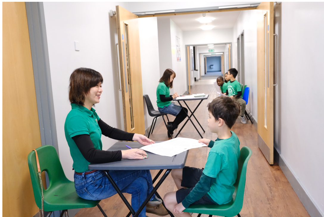
華園歡慶90 閱讀測驗能力比賽2022成果報告1

華園於Autumn Term學期開始即宣布這個閱讀能力測驗比賽活動。教師每週都設計各課閱讀測驗學習單讓學生反覆練習，11月19日進行比賽，11月26日期末時頒獎。剛好所有班級都在這學期教完現在的課本，範圍就是目前課本全冊的課文內容，是期末讓學生和老師檢視學習和教學成果的很好活動，也有助於一月新學年開始的分班。學生經由這個漢字競賽活動的參與跟準備的過程中，對於課本內的漢字有很好的加強練習和掌握，為鼓勵孩子們認真準備，勇於接受挑戰，各班皆取前三名頒發亞馬遜禮卷當獎勵。