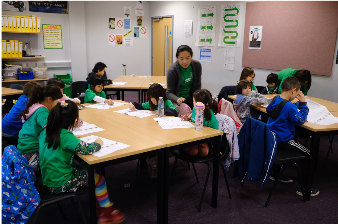
華園歡慶90 閱讀測驗能力比賽2022成果報告4