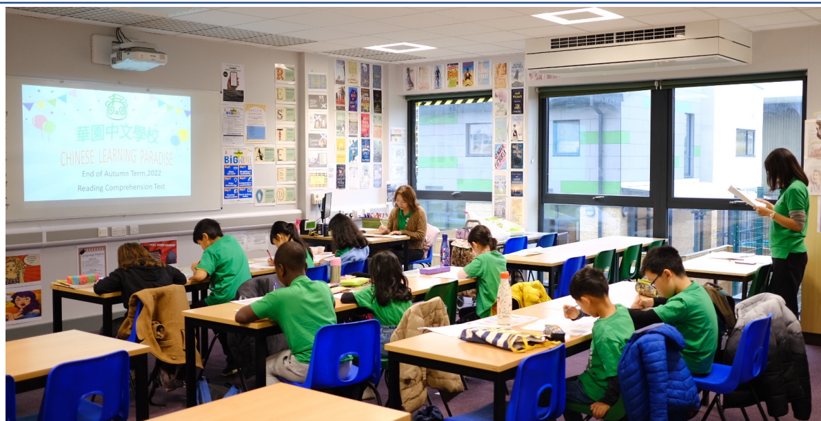
華園歡慶90 閱讀測驗能力比賽2022成果報告2