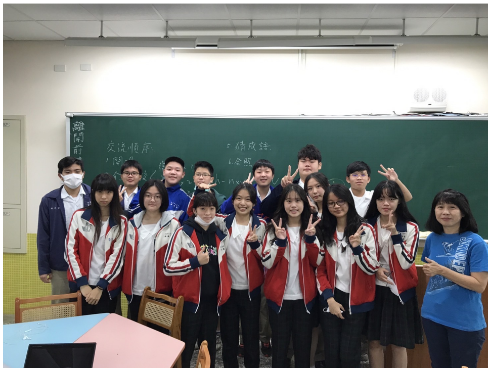
克里夫蘭中文書院2022學年度國際數位學伴計畫1

最後的遊戲也非常有趣，衛道學生先介紹每句成語的故事及意思，包括紙上談兵、杯弓蛇影、守株待兔、等13個成語之後，然後以圖片及同音物品的形式，讓克里夫蘭的學生猜出介紹的成語，讓大家有個腦力激盪的機會，同時更增加趣味性，在一個小時的國際學伴計劃中，兩邊的學生各自了解到校園文化差異，同時在輕鬆愉快的試辦計劃中，也在線上認識了他們的學伴們，大家滿載而歸！