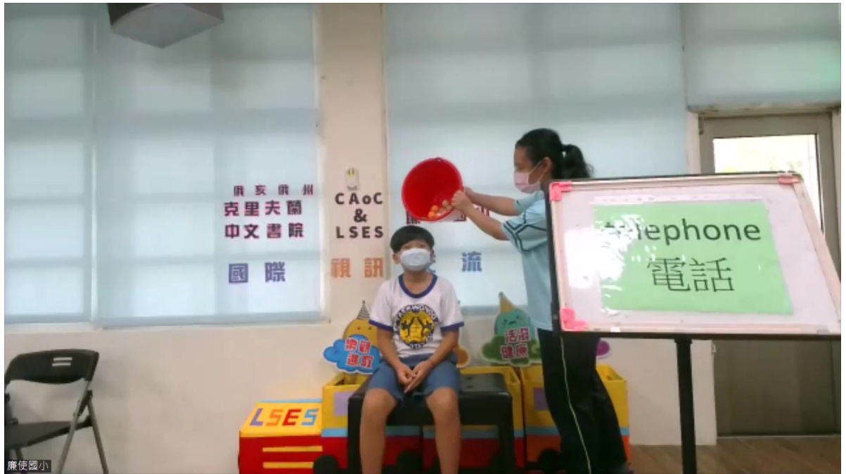
克里夫蘭中文書院2022學年度國際數位學伴計畫6