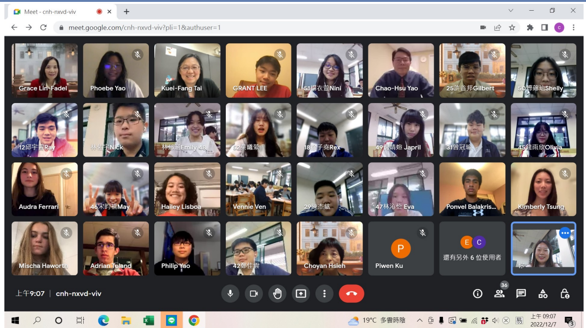
克里夫蘭中文書院2022學年度國際數位學伴計畫2