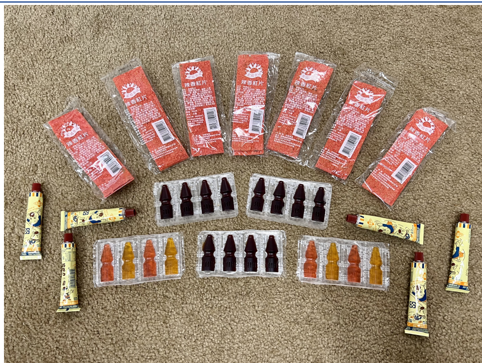
克里夫蘭中文書院2022學年度國際數位學伴計畫3