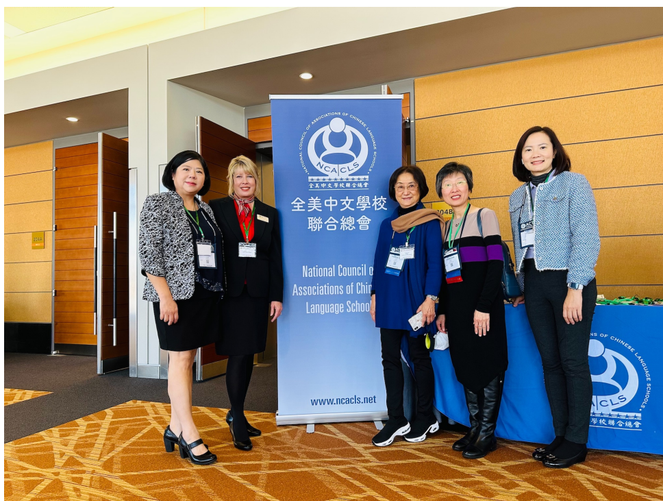
全美中文學校聯合總會ACTFL午宴講座