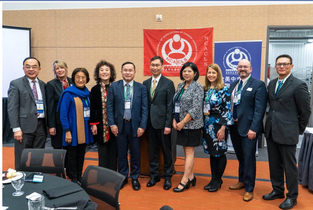
全美中文學校聯合總會ACTFL午宴講座