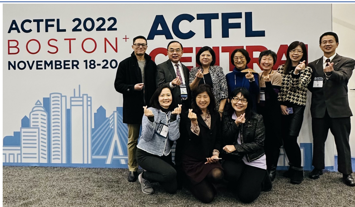
全美中文學校聯合總會ACTFL午宴講座