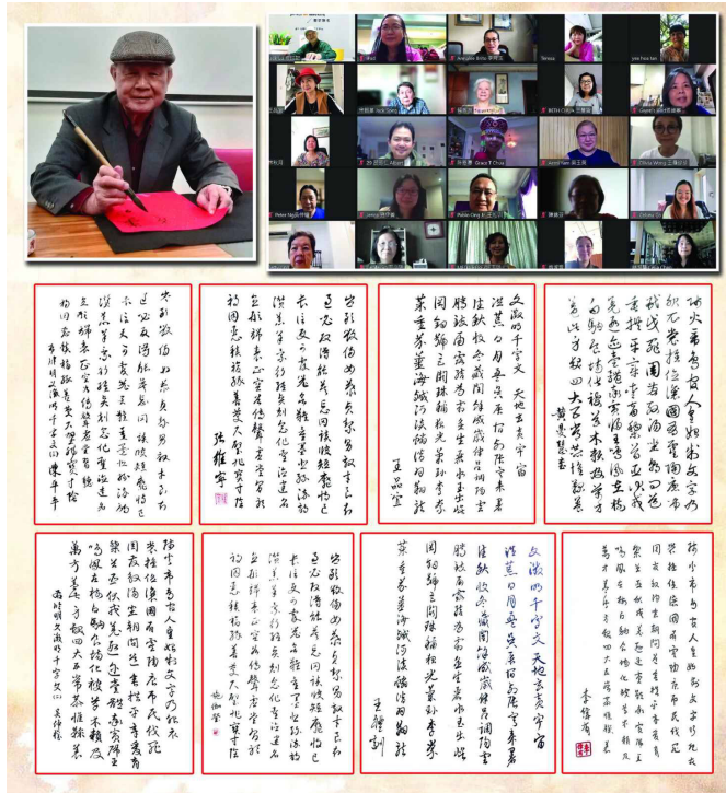
中華文化復興運動總會主辦文經總會文教服務中心協辦2022「菲華暑期文教研習會」線上舉行始業式2