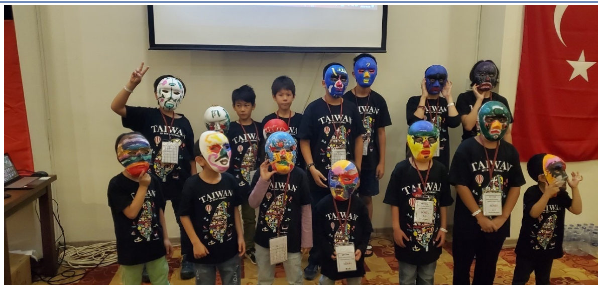
臺灣陣頭介紹彩繪臉譜