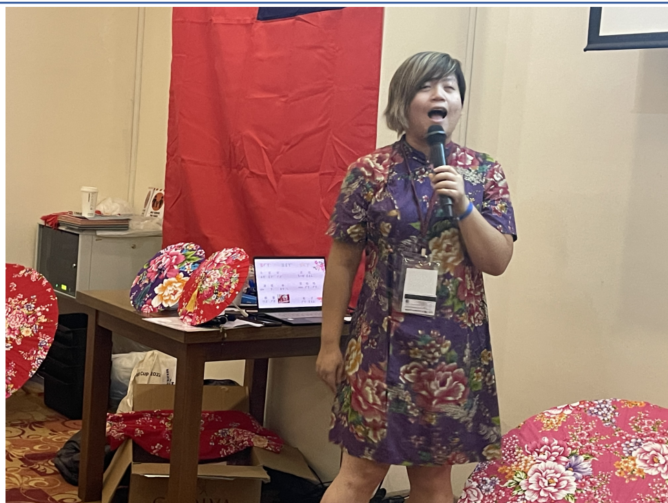
客家文化老師全身客家文化上身