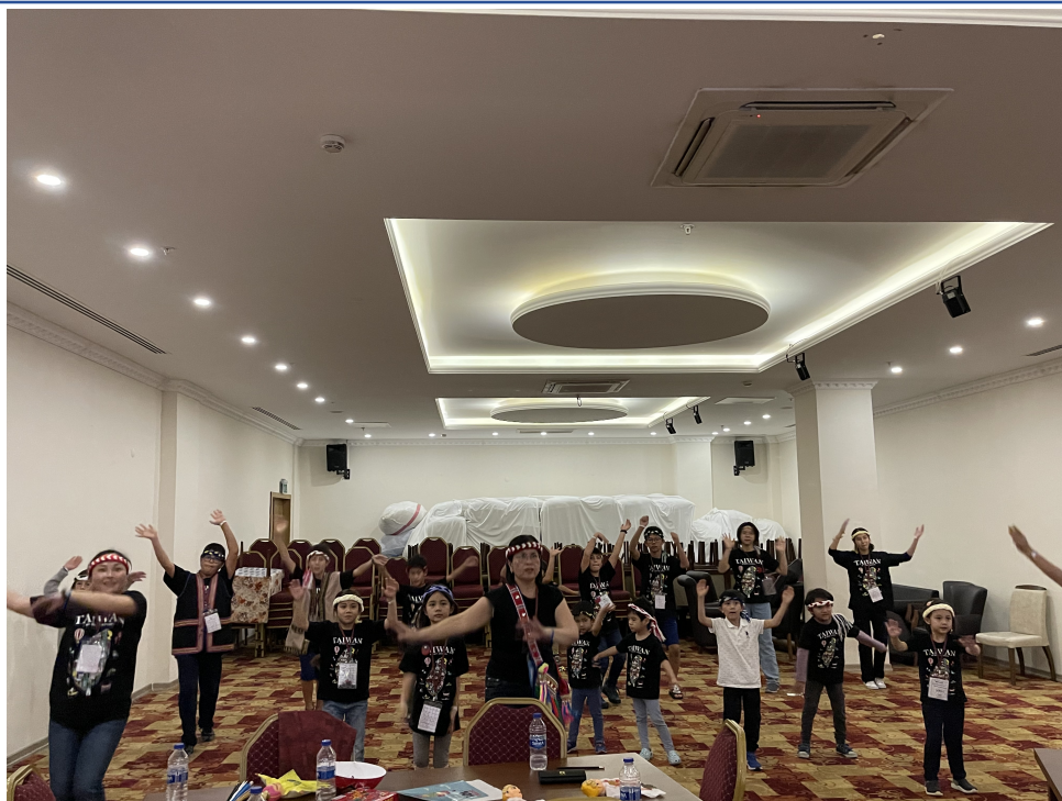
原住民文化編織與海洋之歌舞蹈