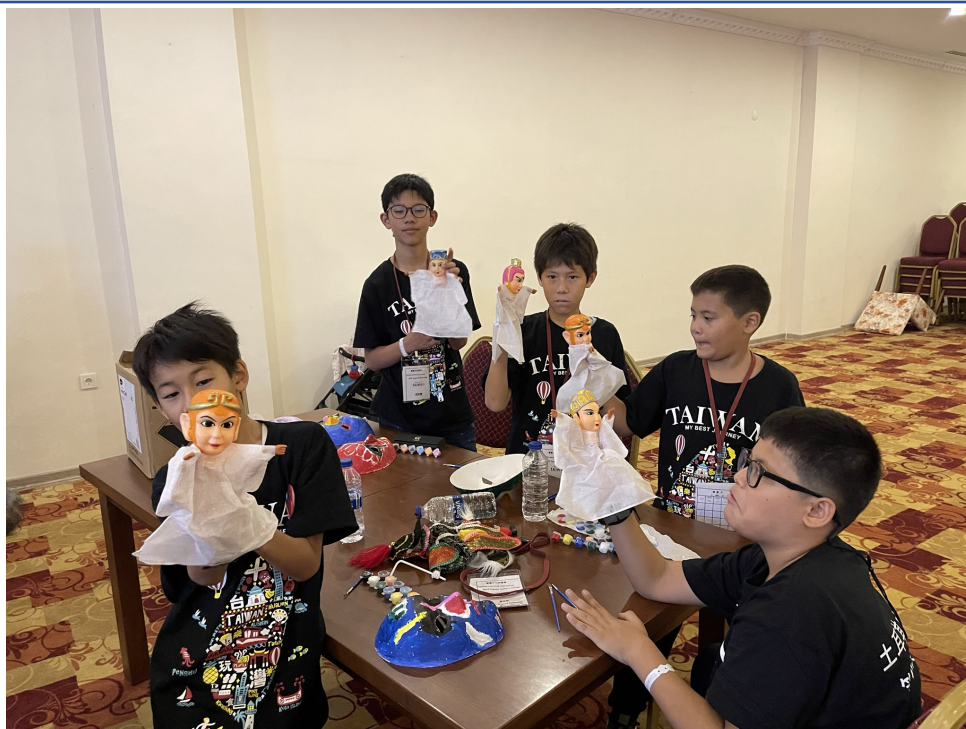
臺灣布袋戲介紹與彩繪