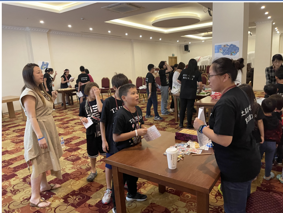
環島遊臺灣闖關換大獎