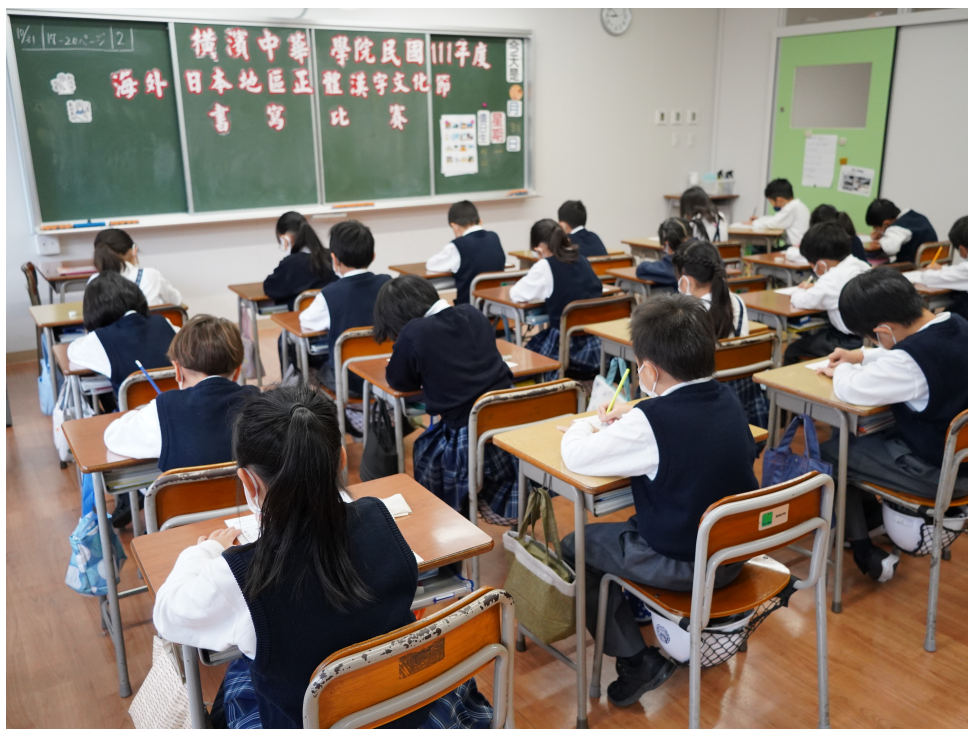
小學部低年級比賽現場