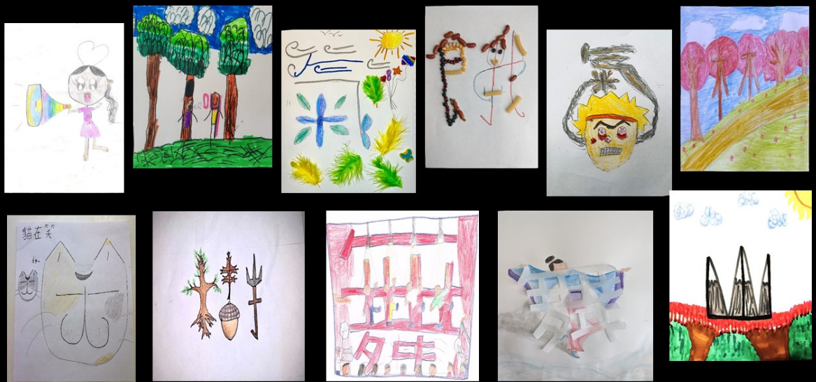
得到佳作獎的十一件作品