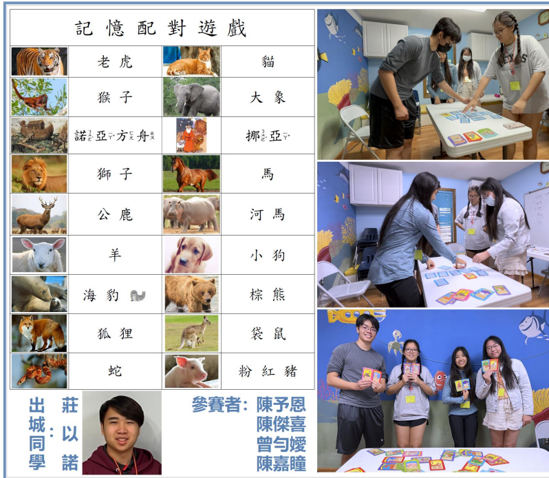
喜樂中文學校高班記憶競賽