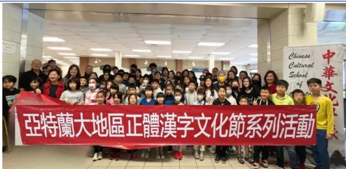
2022年中華文化學校漢字文化節參賽選手與教師和家長合照