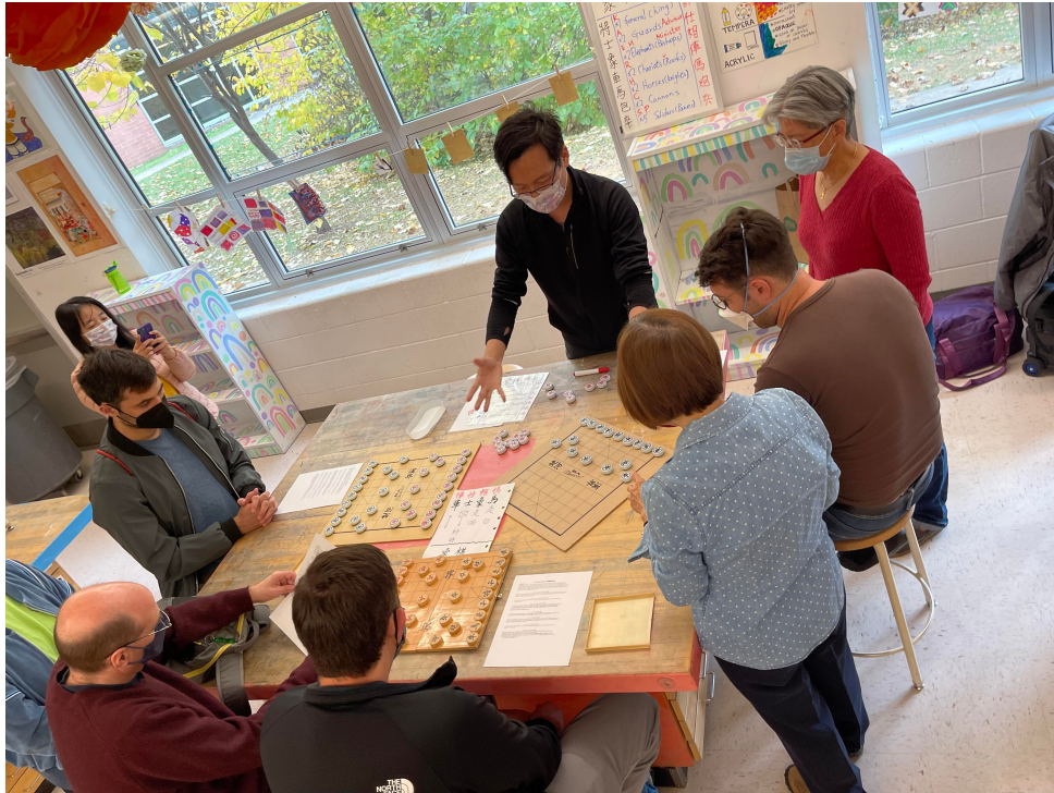
2022年臺灣學校華語文中心舉辦象棋研習並品嚐臺中名產太陽餅5