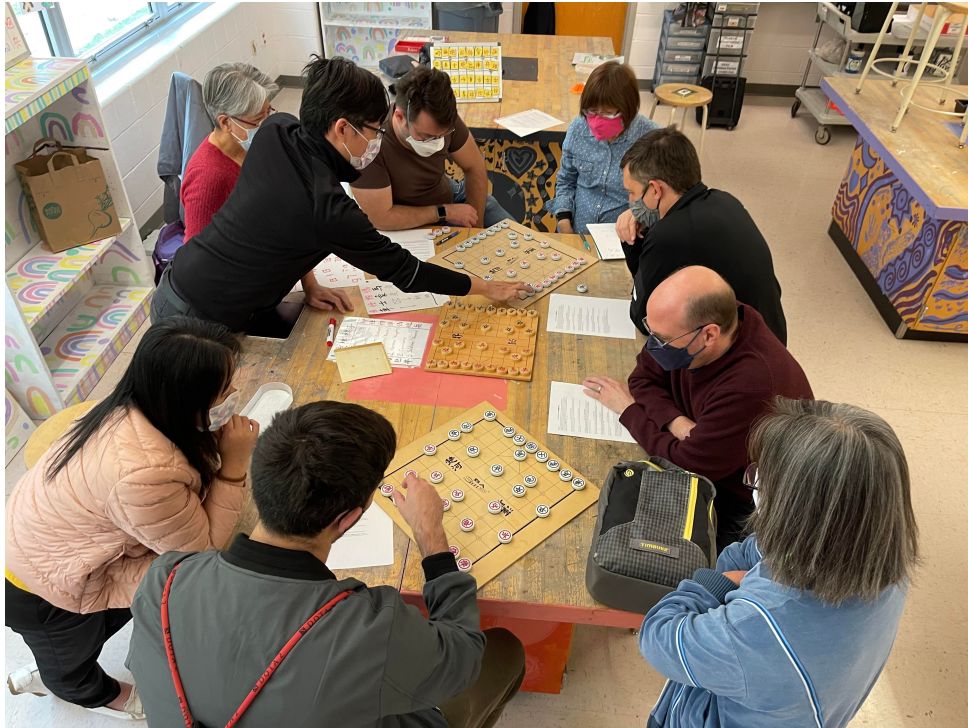
2022年臺灣學校華語文中心舉辦象棋研習並品嚐臺中名產太陽餅2