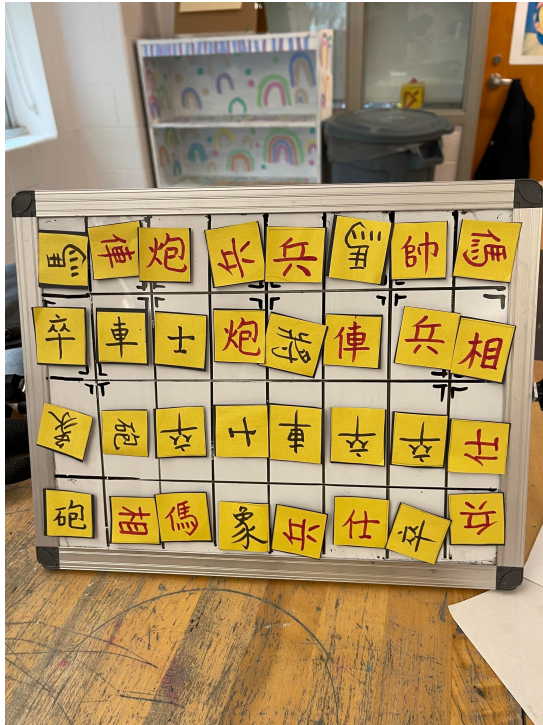
2022年臺灣學校華語文中心舉辦象棋研習並品嚐臺中名產太陽餅3