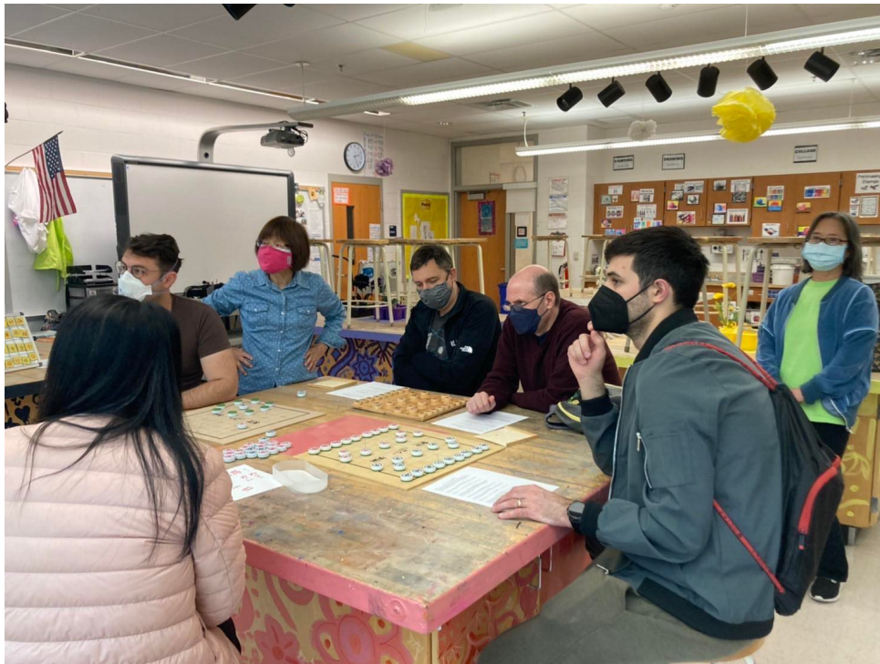
2022年臺灣學校華語文中心舉辦象棋研習並品嚐臺中名產太陽餅1