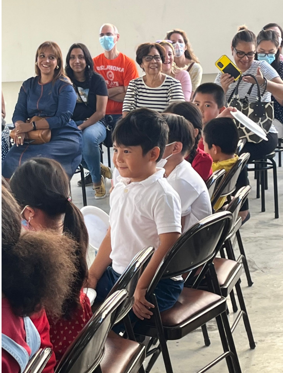
多明尼加臺灣商會附屬中文學校2022年海外漢字文化節之漢字說故事2