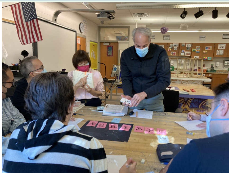
臺灣學校華語文中心舉辦2022年漢字文化節拼字遊戲競賽5