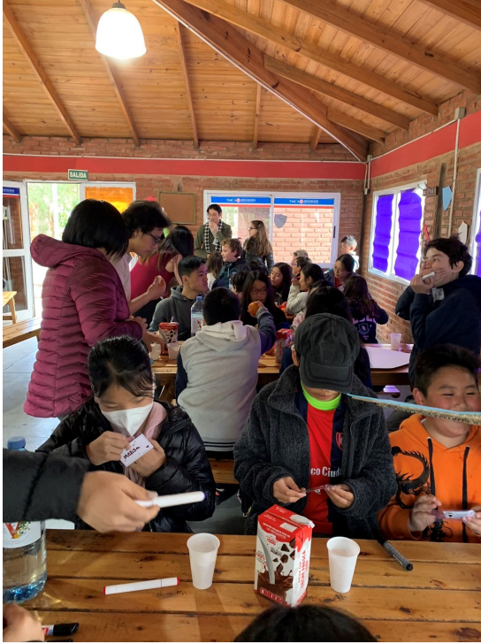
新興中文學校與國際部2022年校外聯合活動2