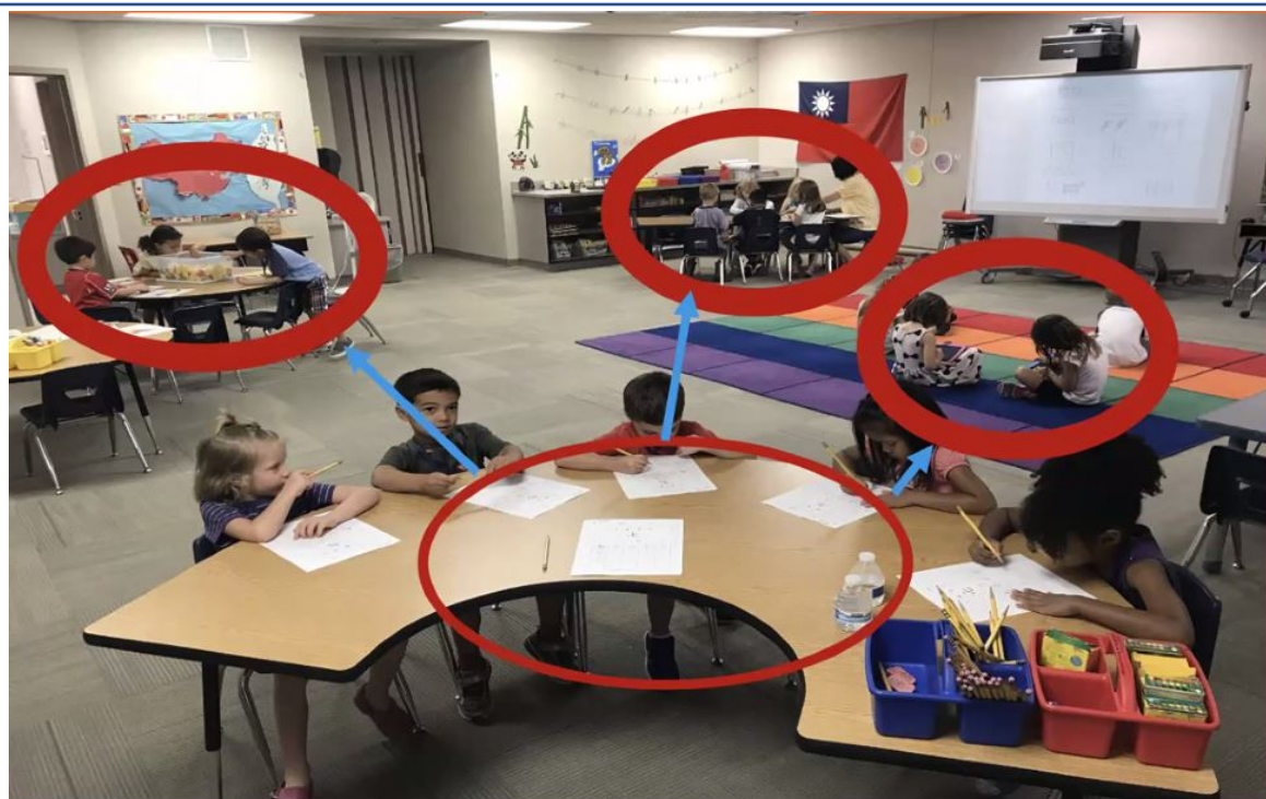
合作學習的實際演練