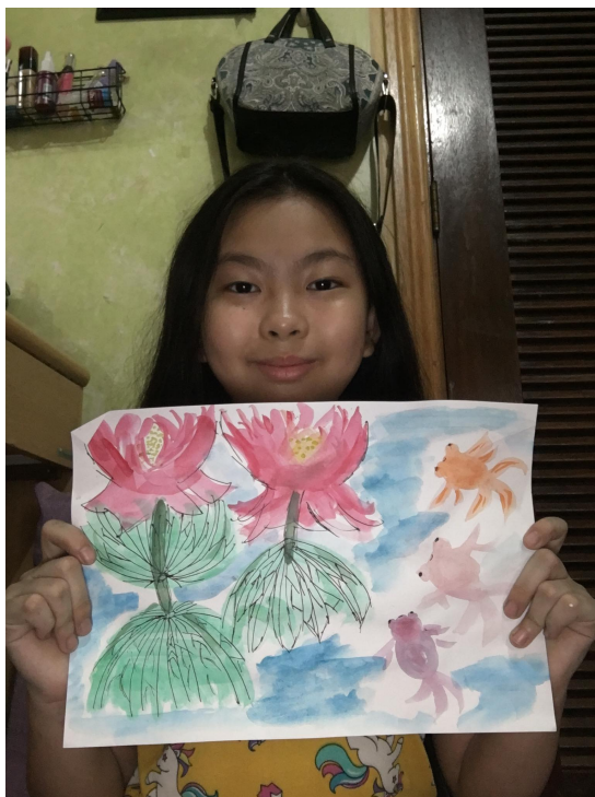
線上研習學生作品

繪畫能夠協助發展語言組織與表達能力。繪畫活動，不只限於讓孩子動手畫，更強調讓學生通過繪畫表達自己獨特的思想和心理活動。在學生們完成作品後，讓他們講講自己的畫面內容，培養學生語言組織與表達能力。