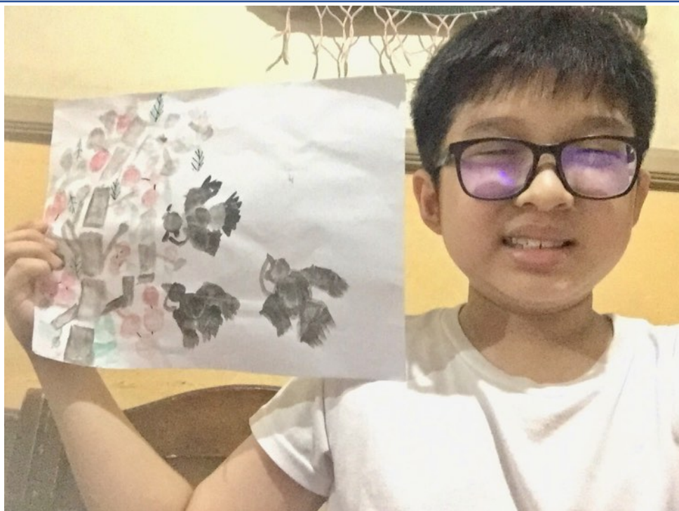
線上研習學生作品