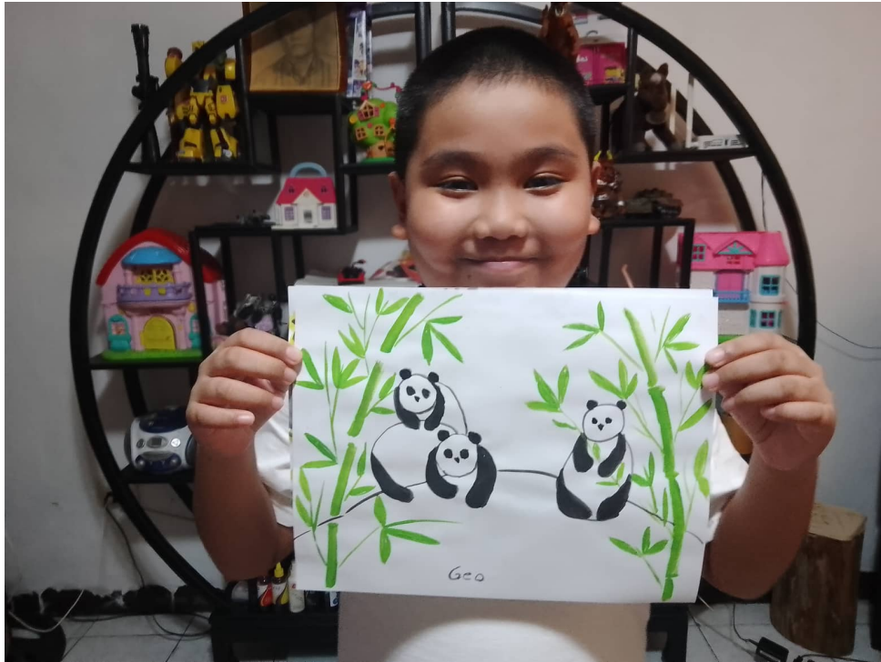
線上研習學生作品