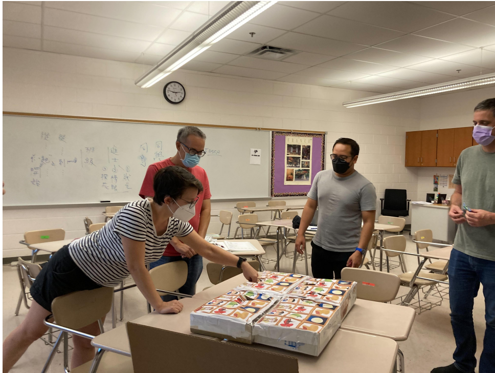
臺灣學校華語文中心土地公戳戳樂和狀元搏餅2022熱鬧登場2