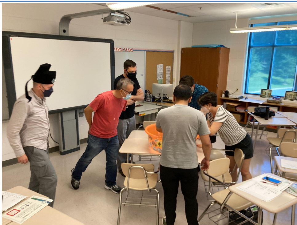
臺灣學校華語文中心土地公戳戳樂和狀元搏餅2022熱鬧登場1