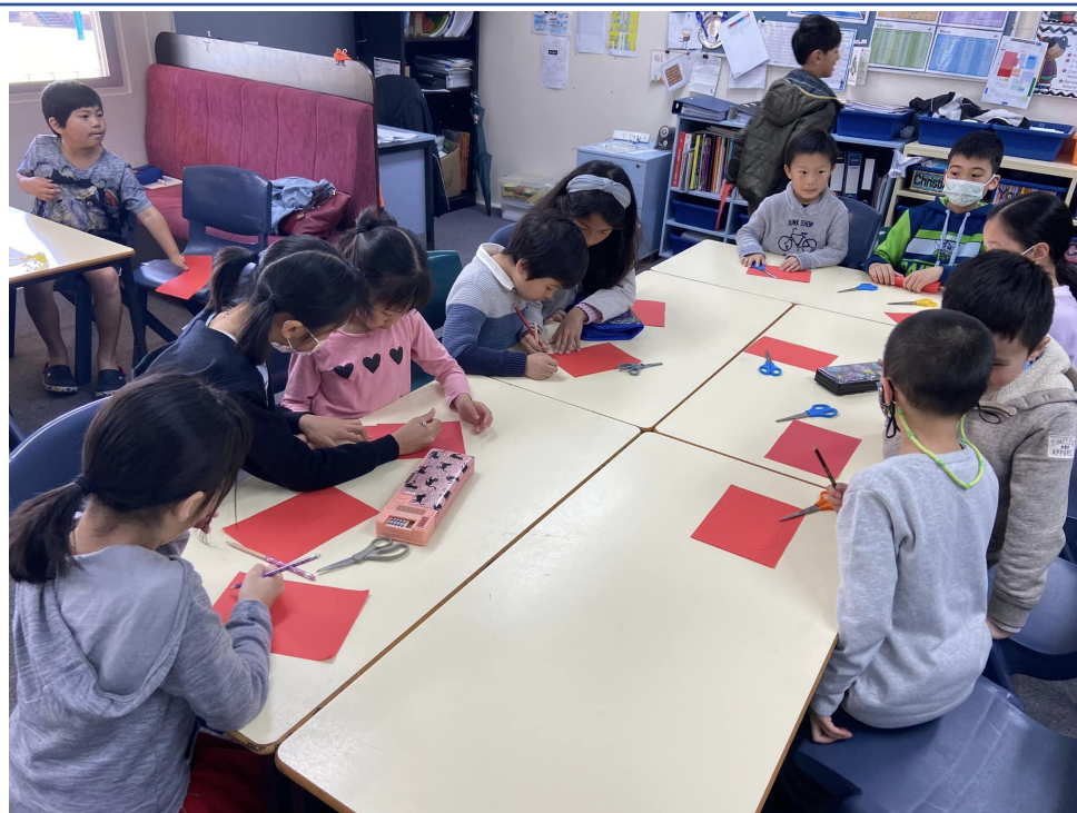
同學們動手做燈籠二