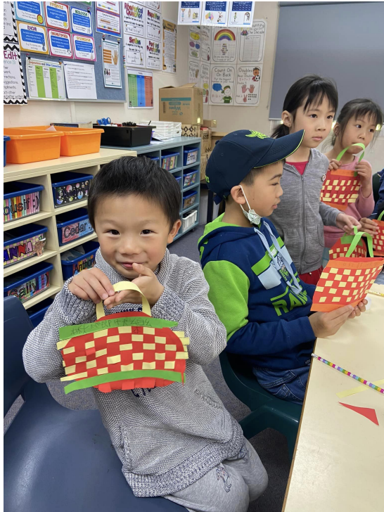
先在鏡頭前展示自己的成品