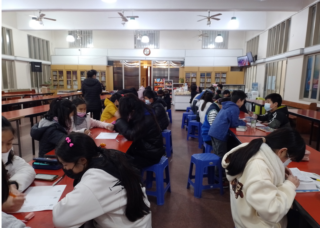
2022學年度愛育學校 「正體漢字文化節國語文國小中低年級組造詞比賽及 高年級組語詞接龍比賽」2