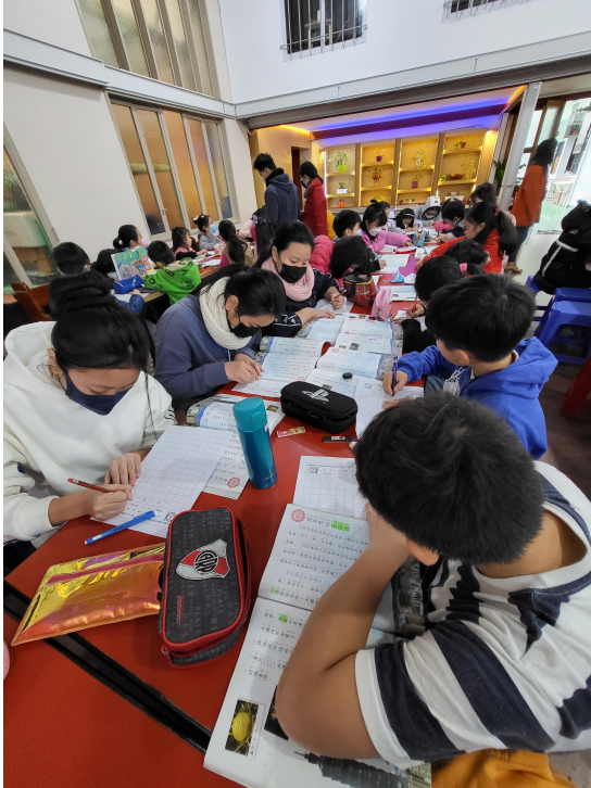
111學年度愛育學校正體漢字文化節「全校寫字比賽」6