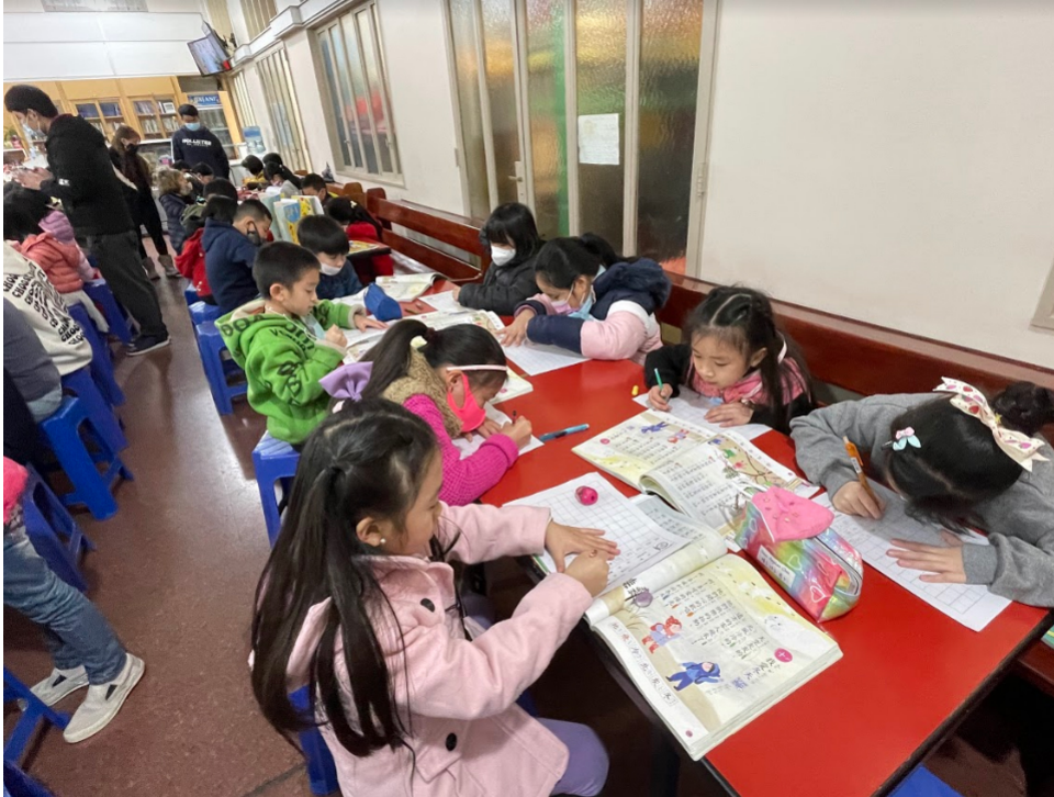
111學年度愛育學校正體漢字文化節「全校寫字比賽」2