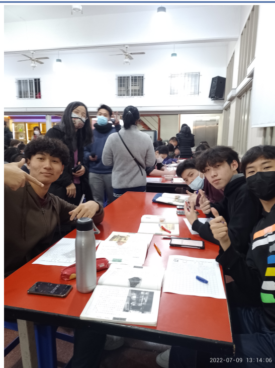
111學年度愛育學校正體漢字文化節「全校寫字比賽」3