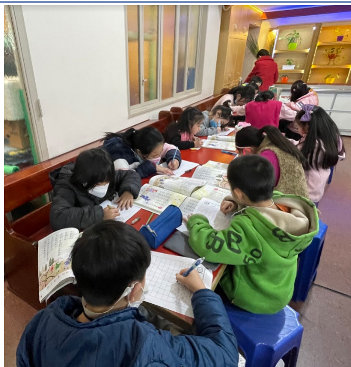
111學年度愛育學校正體漢字文化節「全校寫字比賽」5