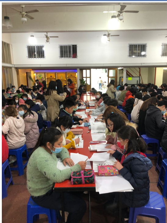
111學年度愛育學校正體漢字文化節「全校寫字比賽」4