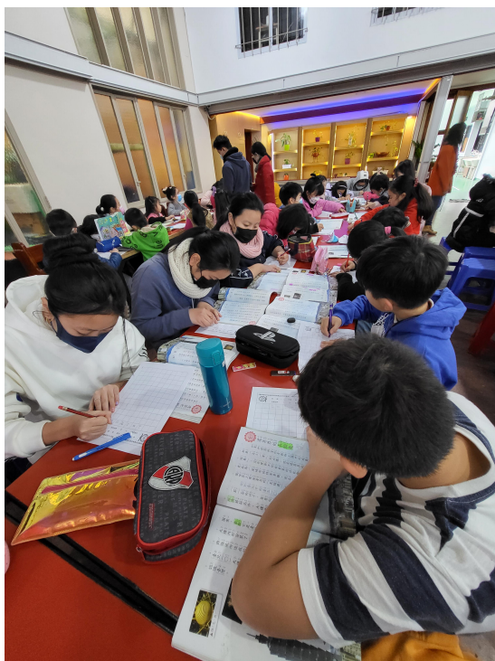
111學年度愛育學校正體漢字文化節「全校寫字比賽」6