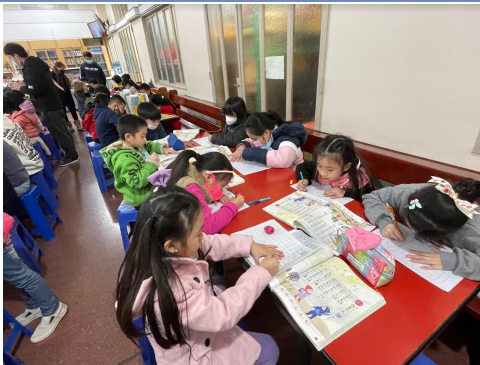
111學年度愛育學校正體漢字文化節「全校寫字比賽」2