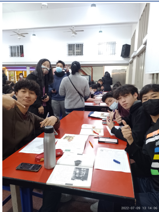
111學年度愛育學校正體漢字文化節「全校寫字比賽」3