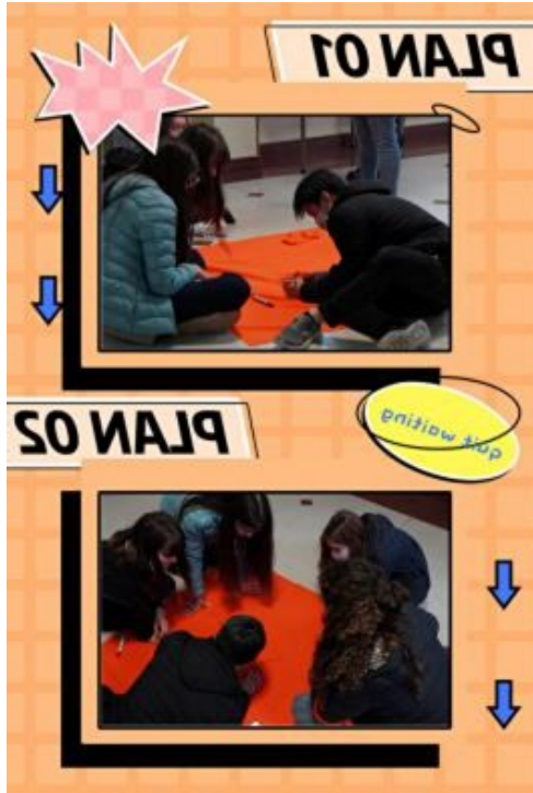
阿根廷新興中文學校國際部漢字搶答趣味競賽（繞口令）2