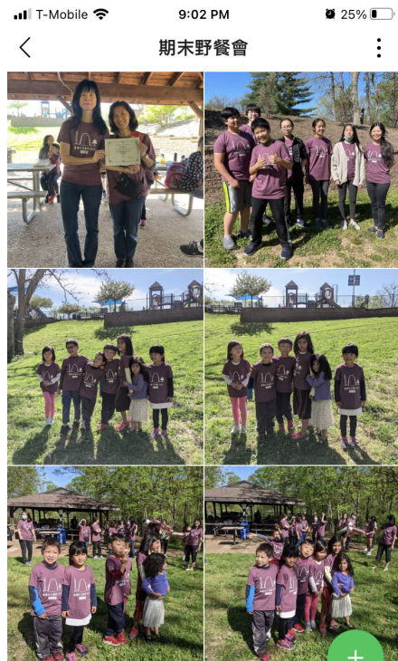
結業典禮 • 2. JPG