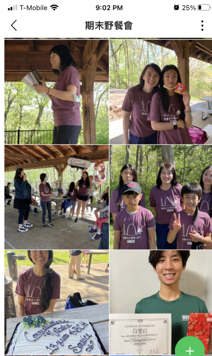
結業典禮 • 1. JPG