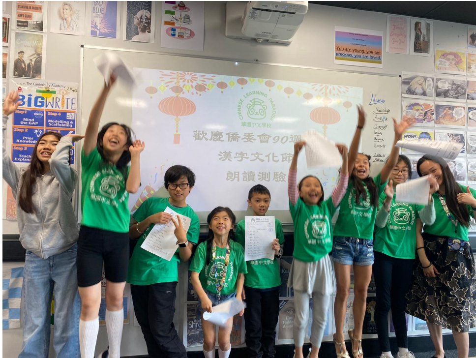
華園漢字文化節-歡慶90 朗讀比賽3