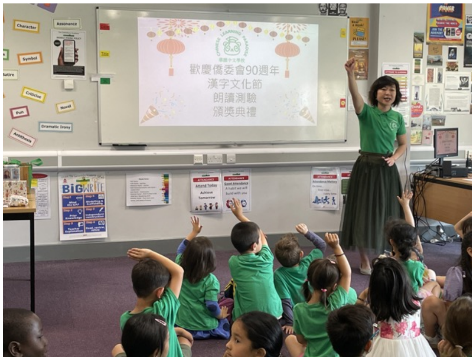
華園漢字文化節-歡慶90 朗讀比賽1

華園於7月2日進行朗讀測驗比賽，由各班教師評選，學生可自行選擇目前使用課本的一課課文做朗讀，教師針對發音和音調同時做朗讀試卷的註記，助教同時錄影，讓想看學生朗讀表現的家長，可以參閱教師的試卷註記和影檔，知道孩子們的朗讀表現還有發音需要加強的地方，並決選出各班的前三名，於期末全校集會時頒獎，藉由此測驗，學生每週積極練習課文朗讀，並繳交音檔給班級教師做修正，於發音上都進步了許多，令人非常欣喜，期末頒獎時，學生更是得到無比的自我肯定。