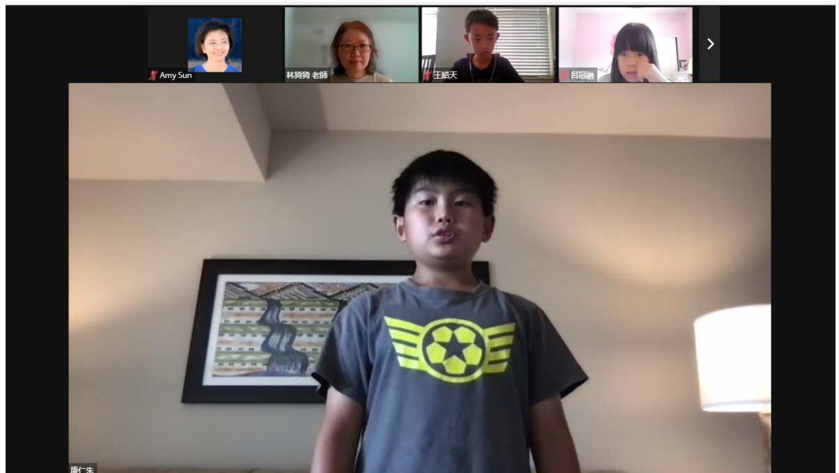
聖地牙哥中華學苑2022年演講比賽1