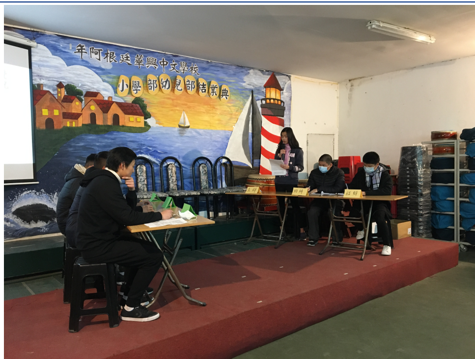
華興學校高中部2022辯論比賽2