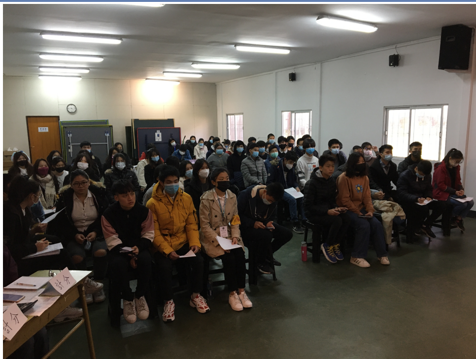
華興學校高中部2022辯論比賽3