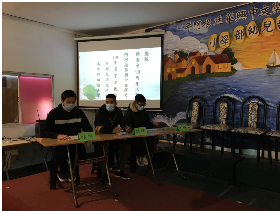
華興學校高中部2022辯論比賽1