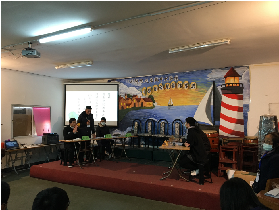
華興學校高中部2022辯論比賽4