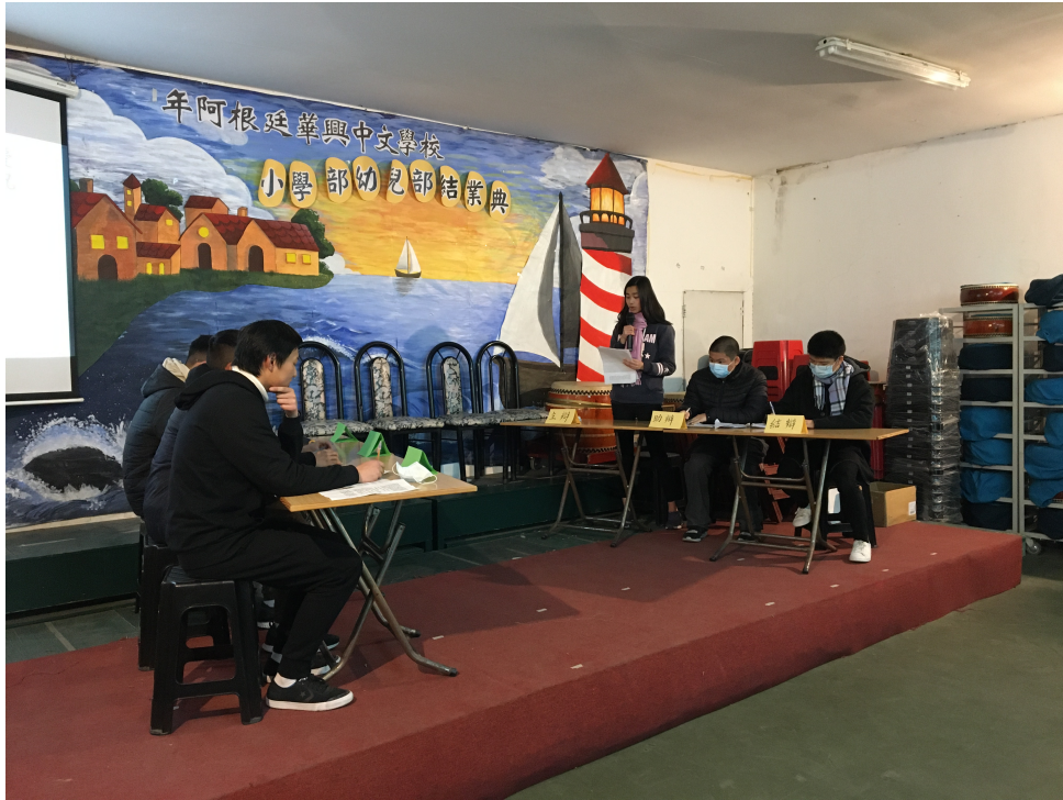
華興學校高中部2022辯論比賽2