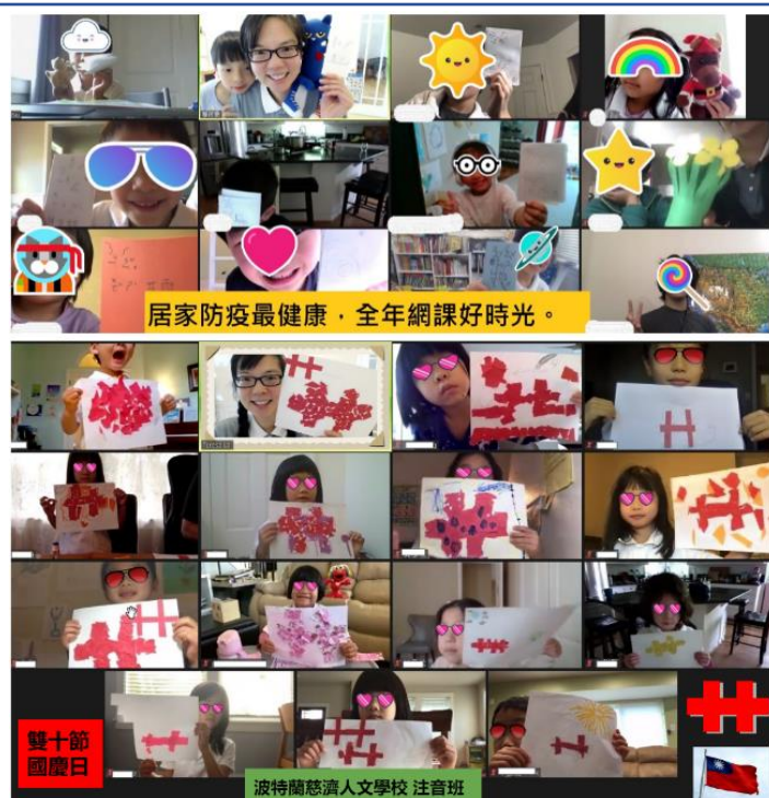
疫情下的網課好時光