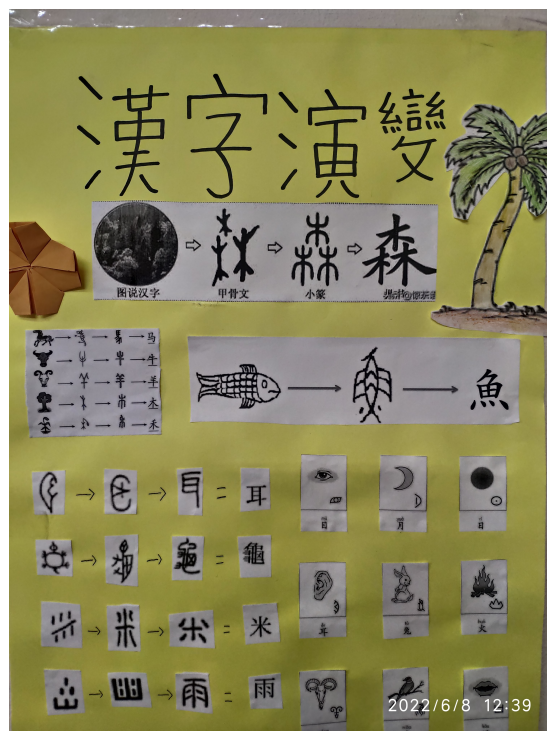
新興中文學校全校2022年漢字演史壁報成果展1