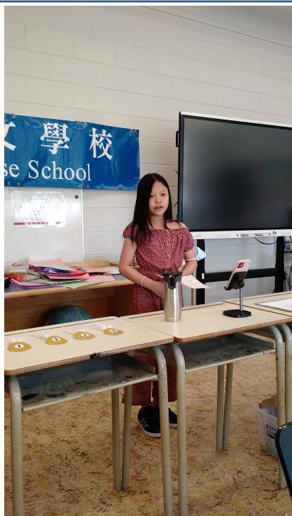
高年級組-我最喜歡做的事