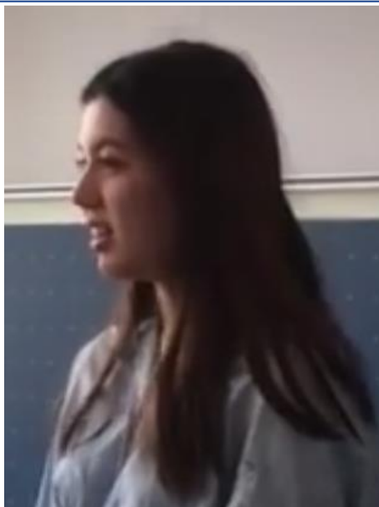
學生演講：我最好的朋友