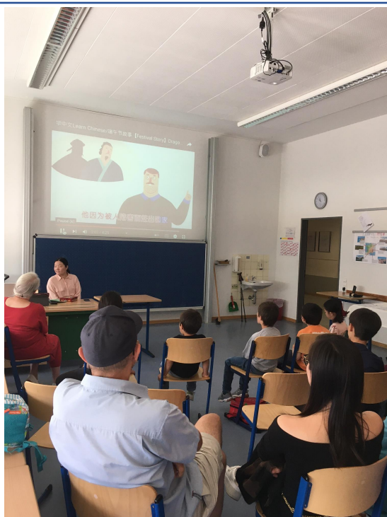
師生及家長一同觀看“過端午，學中文”視頻