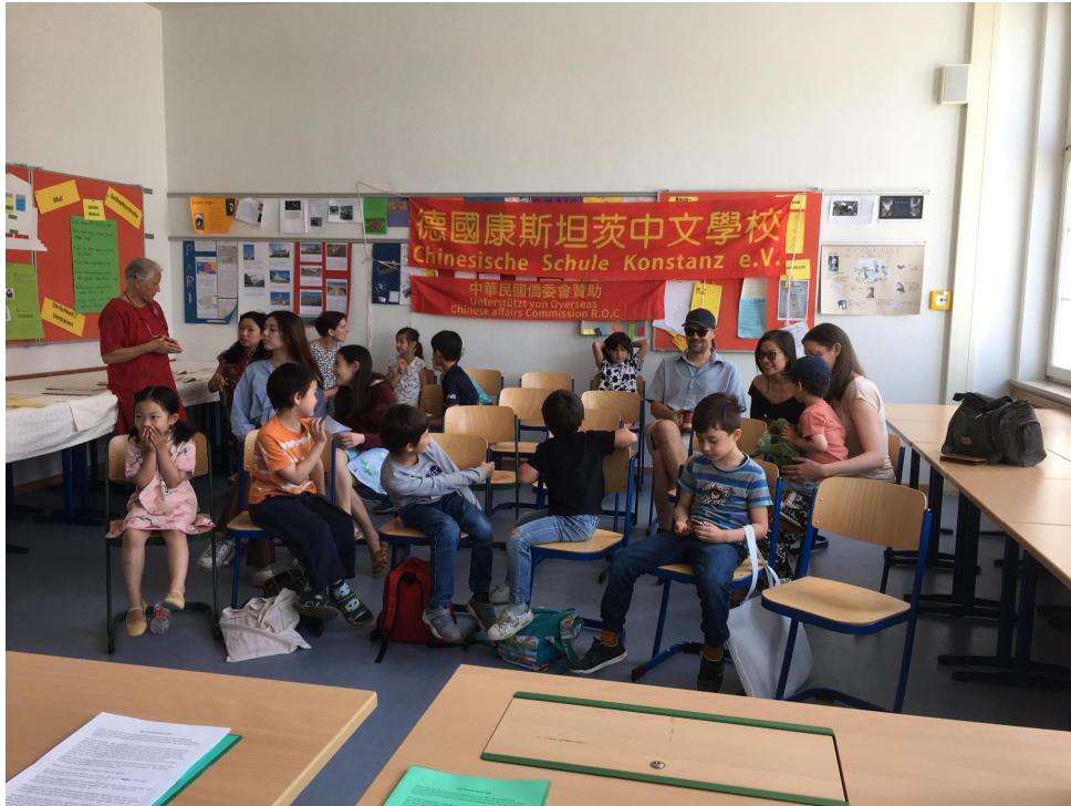
拿到粽子，小朋友笑顏逐開。