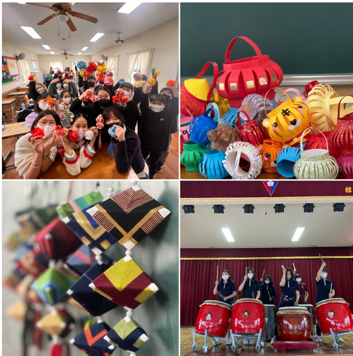
韓國仁川華僑中山中小學慶祝僑委會90週年暨2022年正體漢字文化節系列活動1

韓國仁川華僑中山中小學由衷地感謝中華民國僑委會及駐韓臺北代表部多年來對本校僑教上長期的關心與協助。