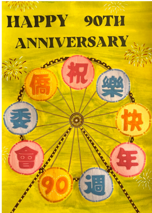
韓國仁川華僑中山中小學慶祝僑委會90週年暨2022年正體漢字文化節系列活動3