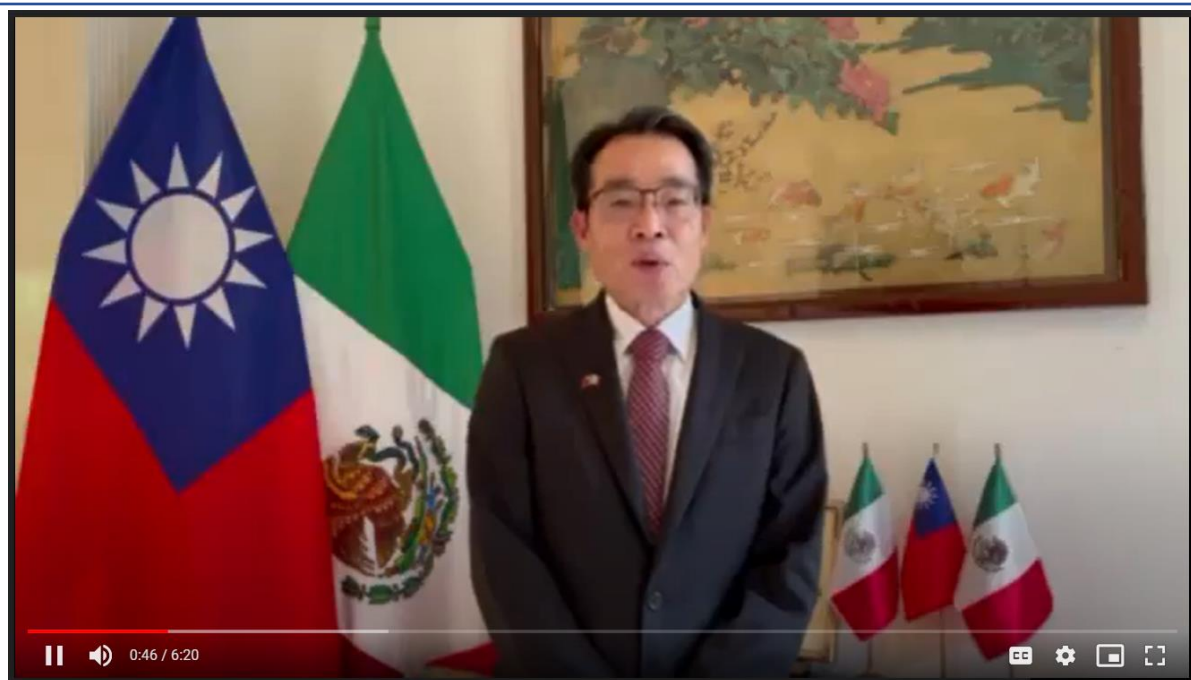
鄭正勇鄭大使致祝賀詞