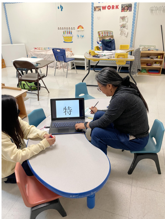
高年級學生認字比賽