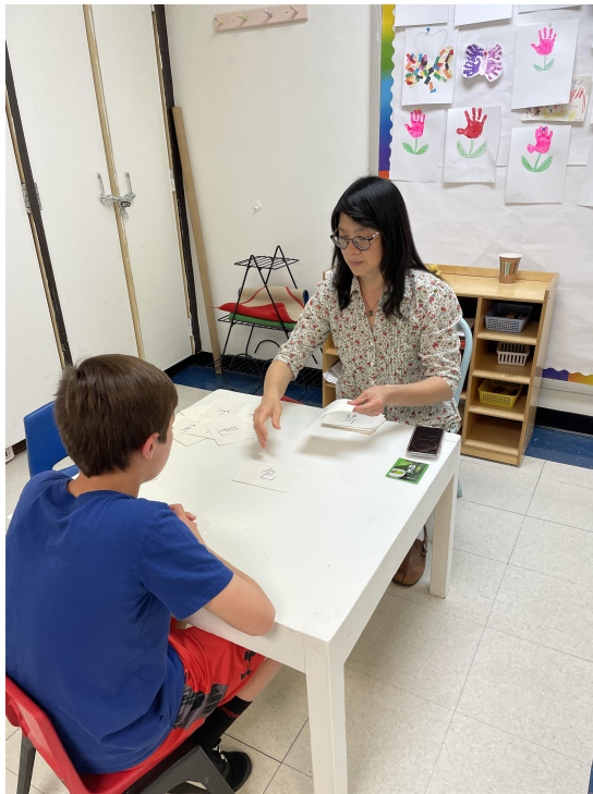
高年級學生認字比賽