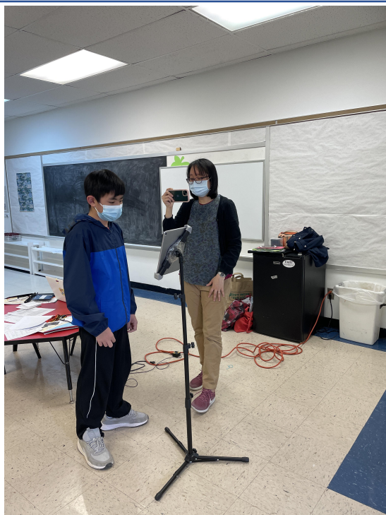
老師錄影學生的認字比賽