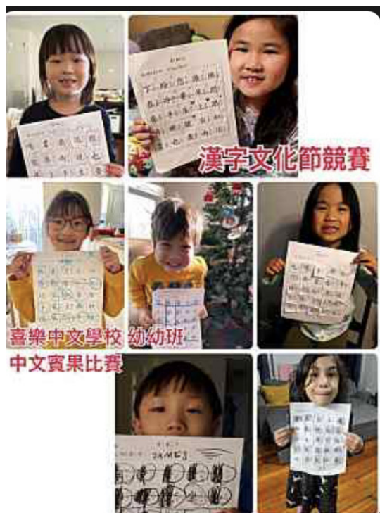
2022-Q1 幼稚園1. JPG

配合第十冊的「茶文化」，高年級舉辦了「茶的種類及介紹」，從六大茶系列中，由每一位同學來選擇並介紹茶的種類及功效，讓我們藉此了解茶在生活中扮演舉足輕重的角色。學生們不但仔細的介紹自己代表的茶系，並提供三個問題反問同學以為加深學習印象，反映不錯。中班的「認識臺灣-爸媽從哪裡來」，借這個機會讓孩子們能夠知道爸爸媽媽的家鄉，並藉此認識臺灣的縣市及地理位置。小班的「我畫我猜比賽」競爭十分激烈，從遊戲中學習中文，生動又活潑的教學，無形中讓孩子他們認識了很多新詞。小小班的創意寫作，題目是「生肖虎的故事介紹」，孩子們利用所學有限的生字或注音來介紹新年吉祥物「虎」，非常用心，值得獎勵。幼稚園也用遊戲的方式「中文賓果比賽」，讓他們認識靈活地使用注音符號，孩子們都玩得非常開心，非常感謝家長全力的幫忙。