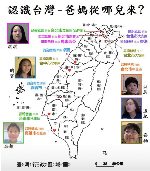
*2021-Q1 中班1. JPG