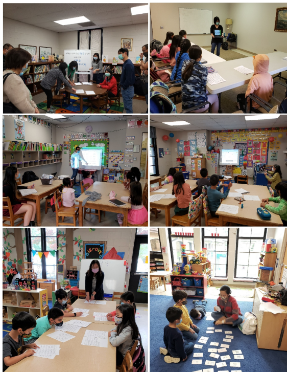
教務向家長評審們解說評分方式和標準。各班學生老師們在檢定比賽開始前把握時間複習字詞