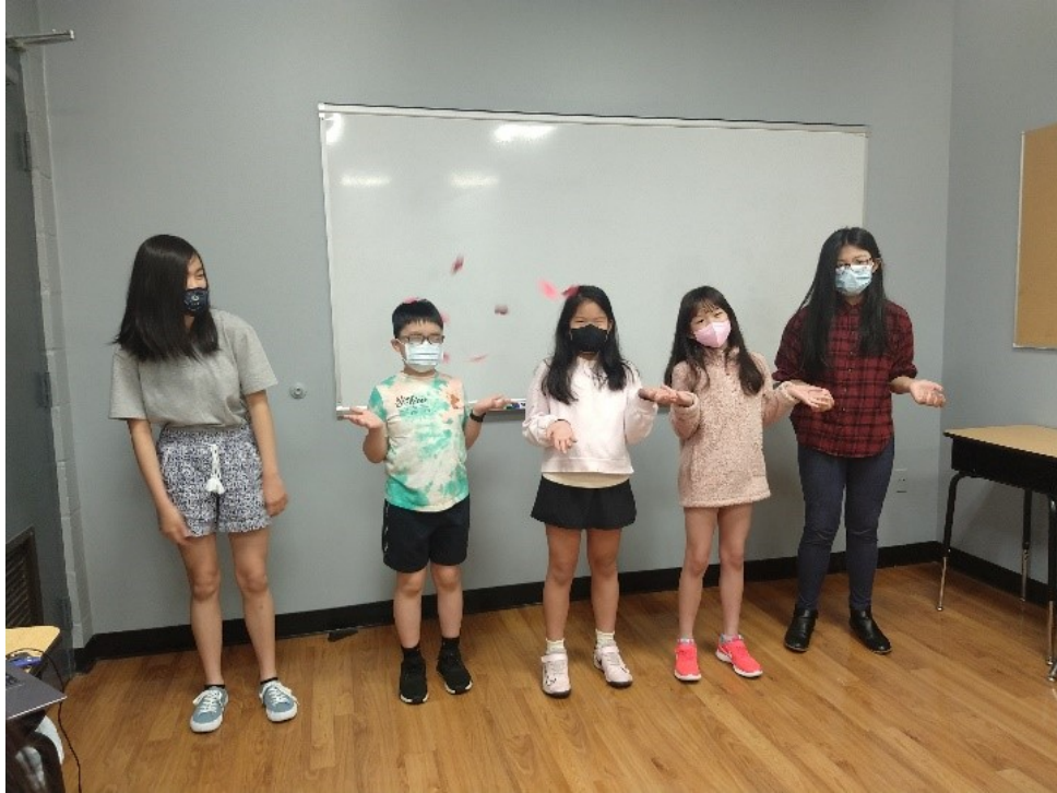
中年級班創意詩詞朗誦