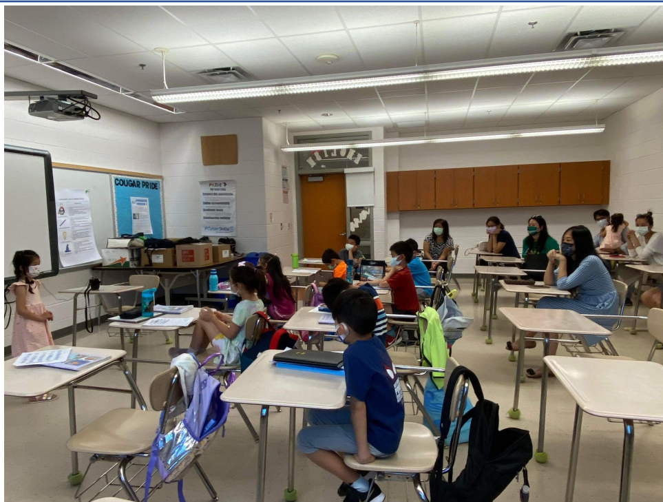
小班組進行「自我介紹」