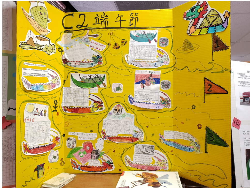
二年級班展示端午節相關壁報展覽