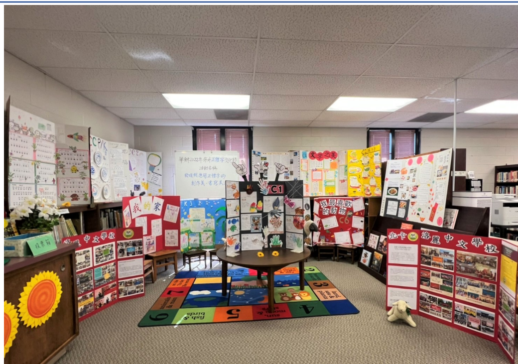
實體漢字文化節活動展覽