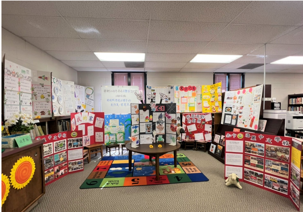
實體漢字文化節活動展覽