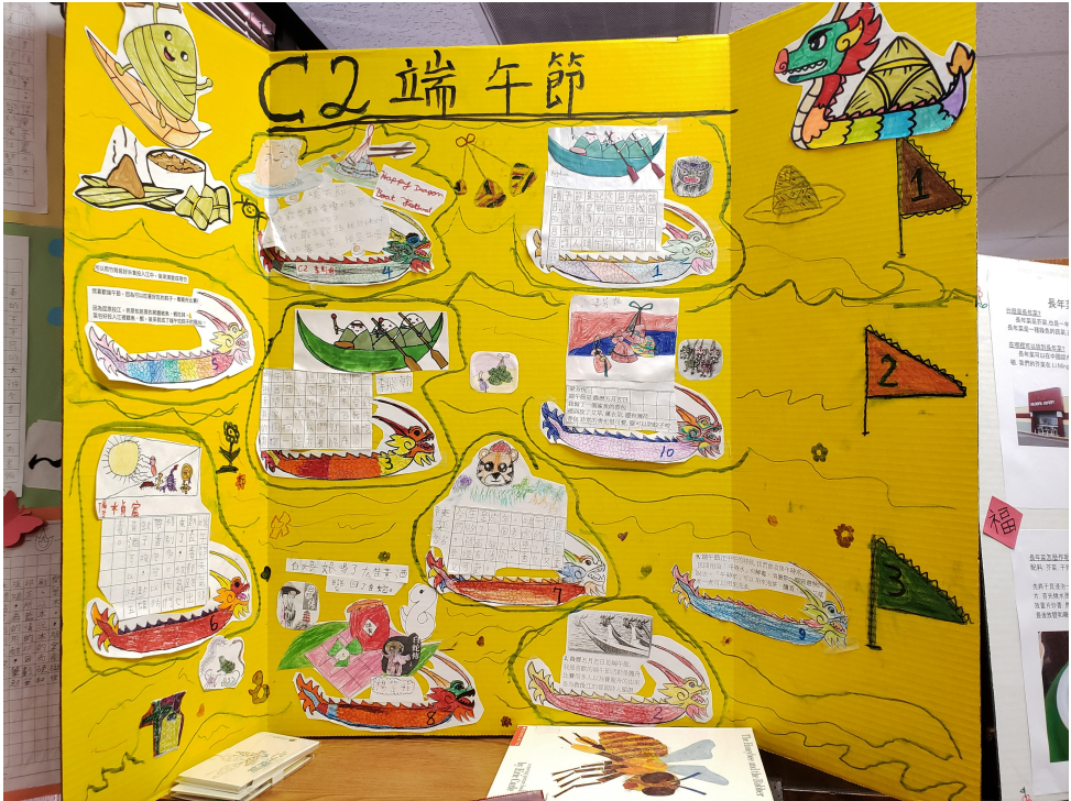
二年級班展示端午節相關壁報展覽