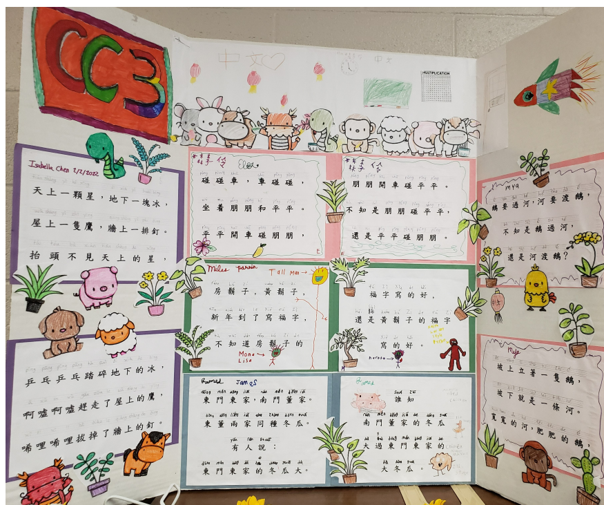
三年級班正體漢字及拼音繞口令