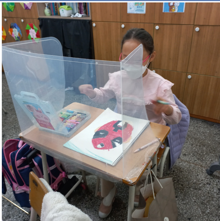
韓國永登浦華僑小學2022漢字文化節3