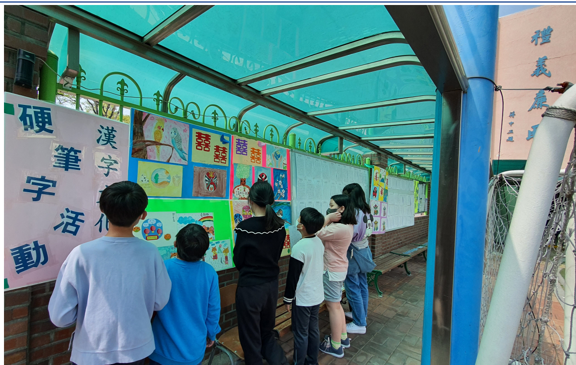
韓國永登浦華僑小學2022漢字文化節2