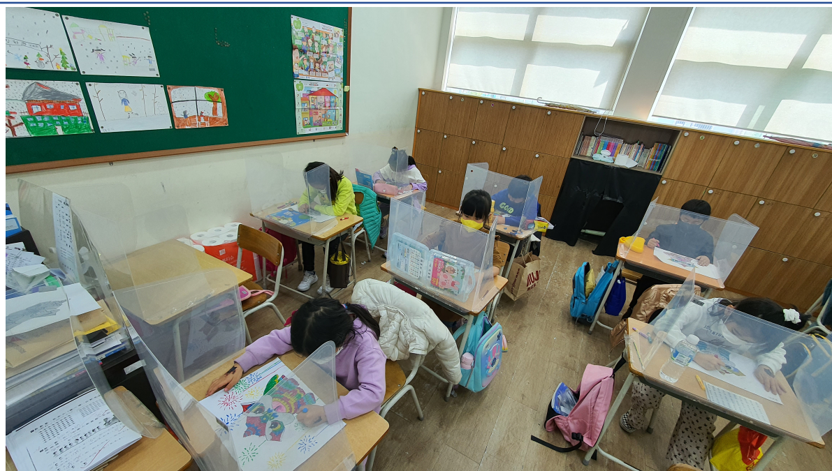
韓國永登浦華僑小學2022漢字文化節5