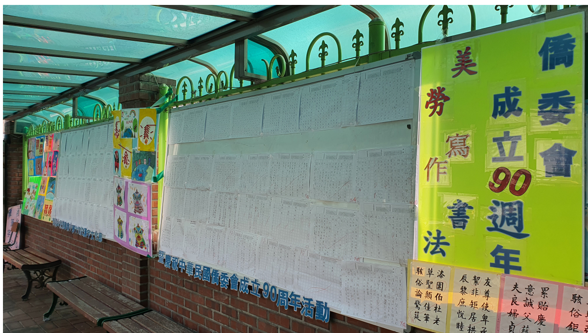
韓國永登浦華僑小學2022漢字文化節6