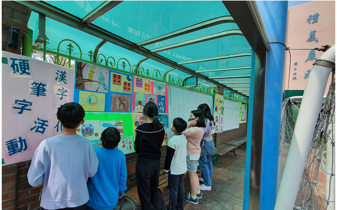
韓國永登浦華僑小學2022漢字文化節2