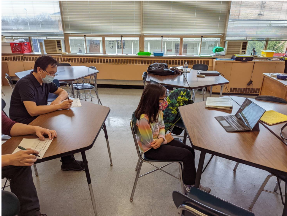
克里夫蘭中文書院2022正體漢字文化節 識字詞比賽3