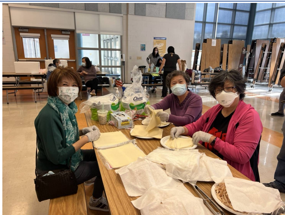
年輕阿嬤們幫忙準備材料