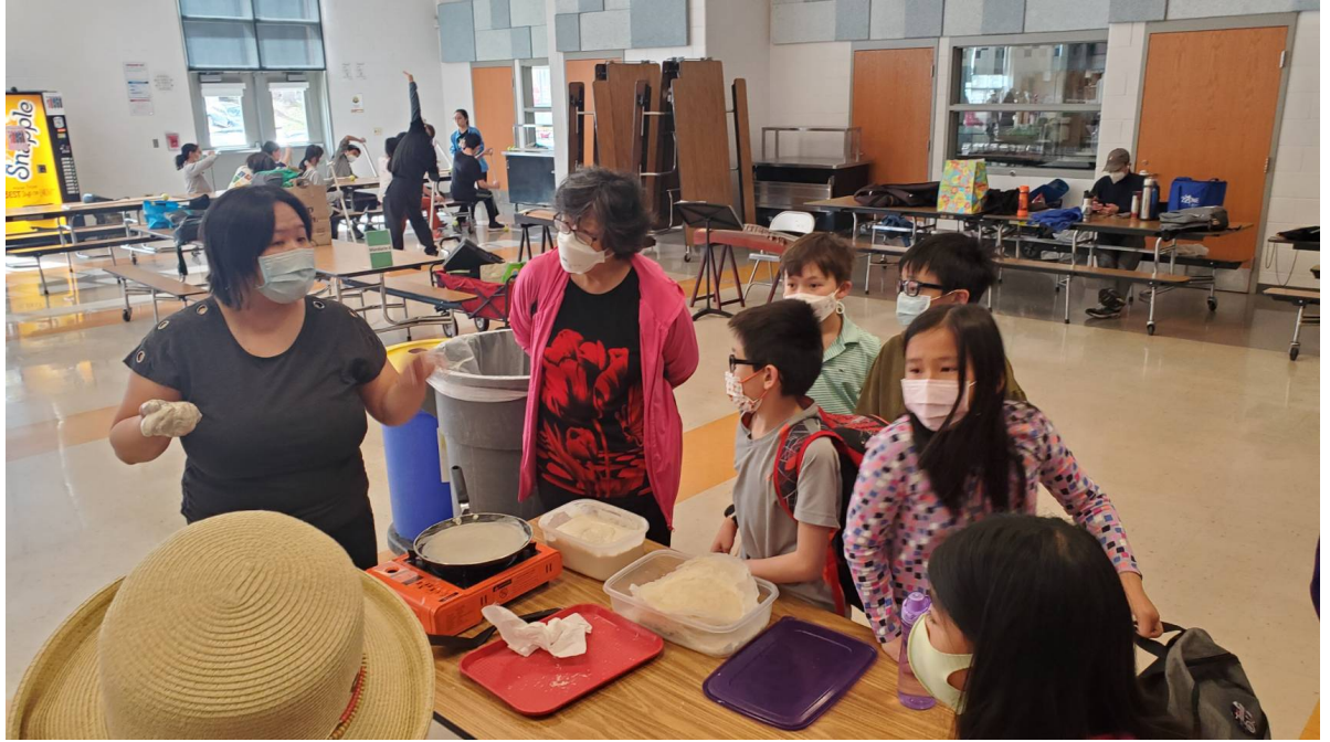
CC 老師教學生如何做潤餅