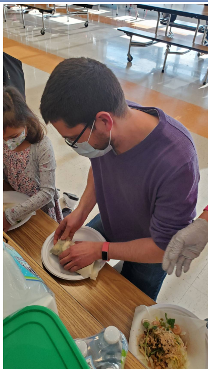
家長教小朋友如何把潤餅包的漂亮