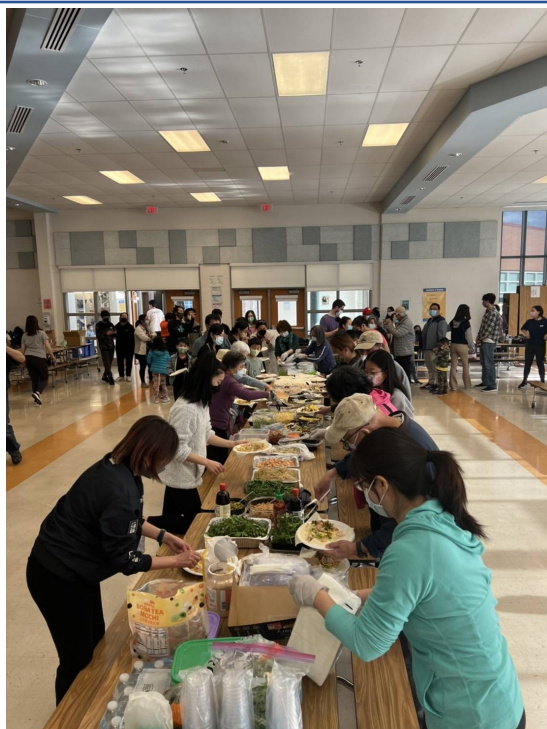
師生家長們排隊包潤餅