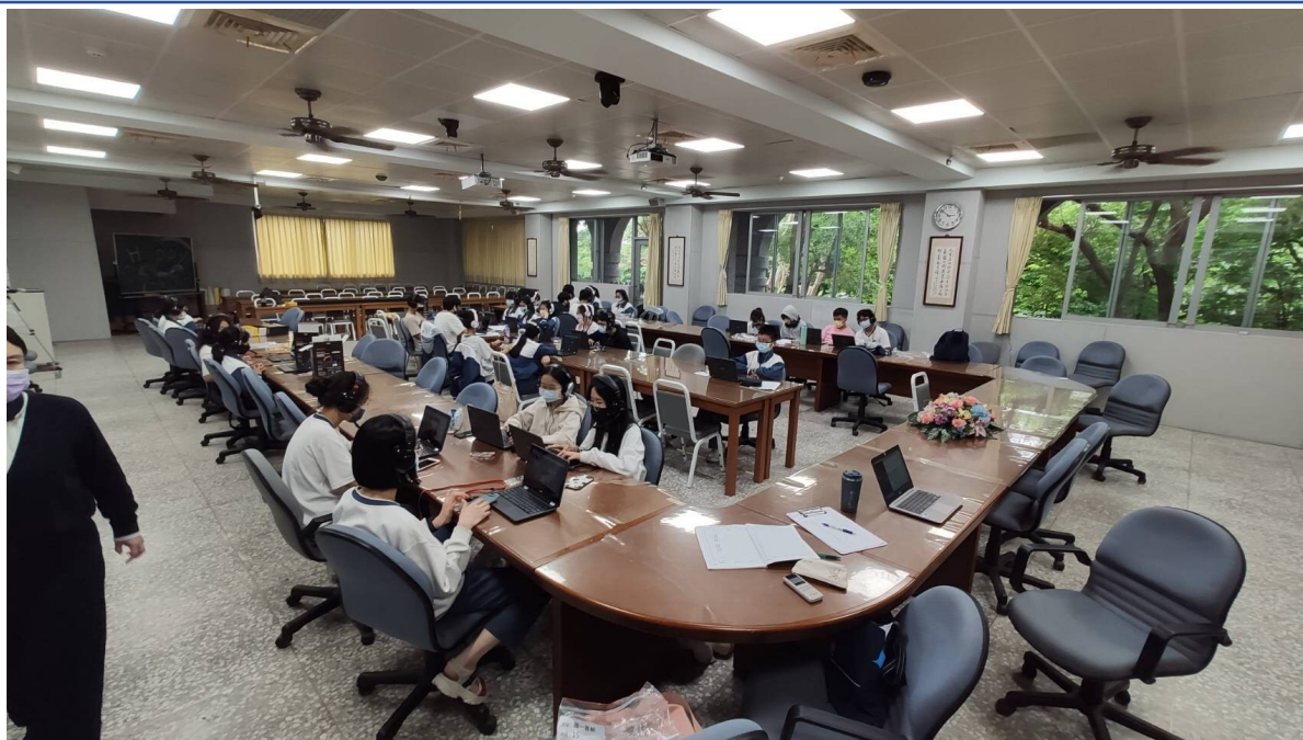
慈大附中學生進行分組交流