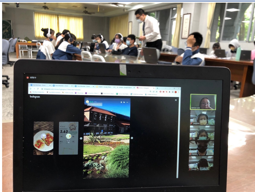
慈大附中雲端教室交流現場