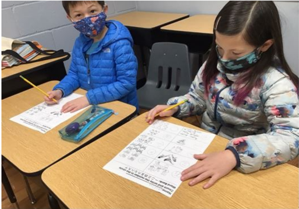
五年級班學生用心在老師出的試卷上作答