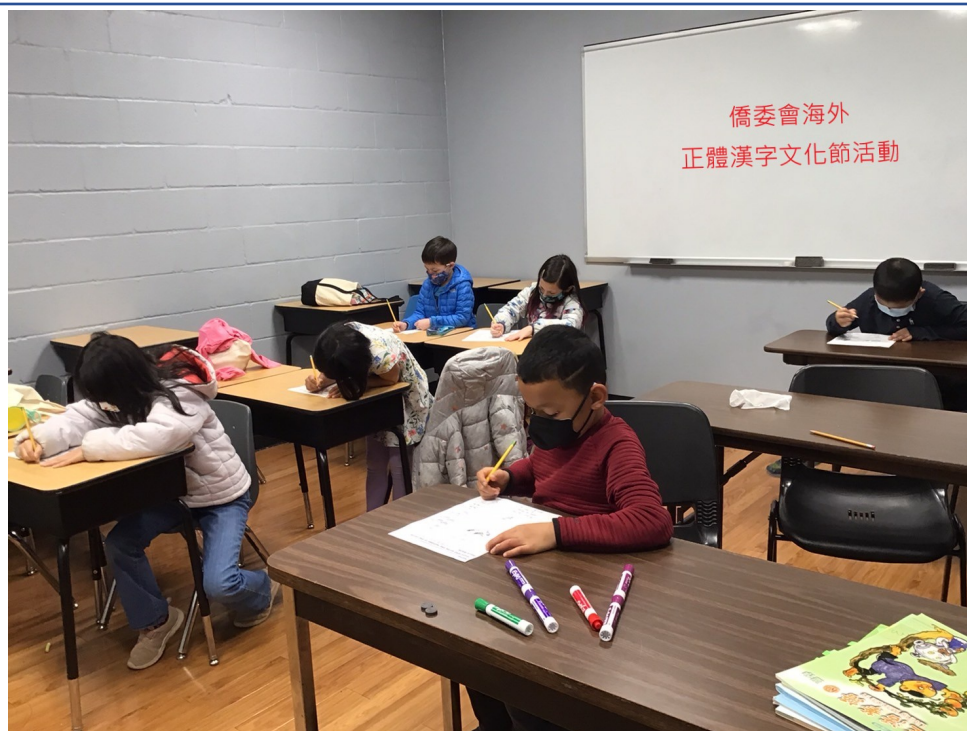
低年級班識字比賽