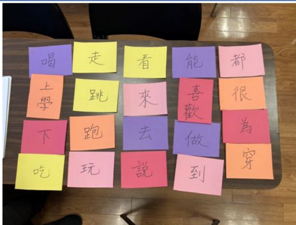
運用自製自卡做識讀題目